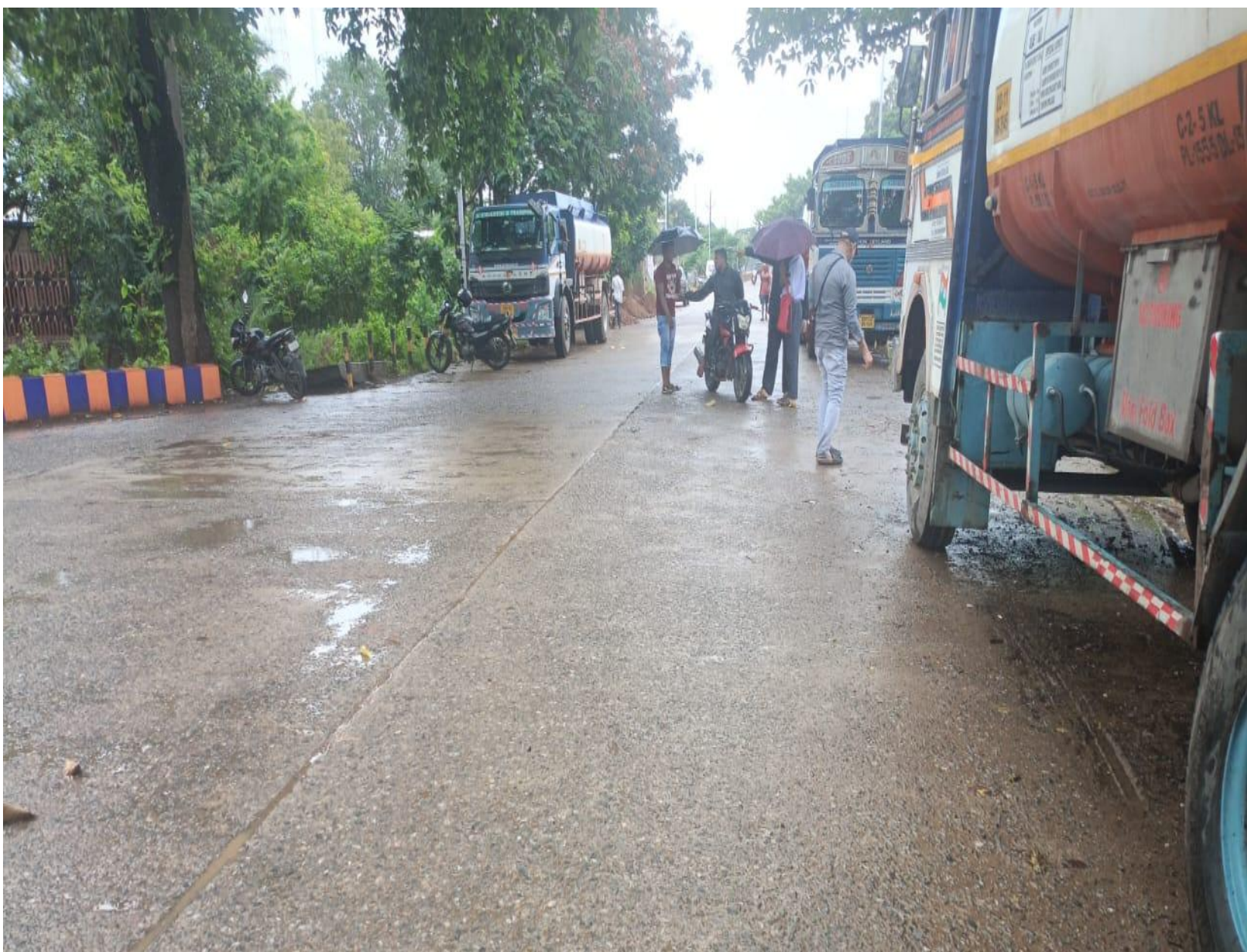
IMAGE: Sharp turn; Risk Level: High; Coordinates: 21.494401, 58.545468