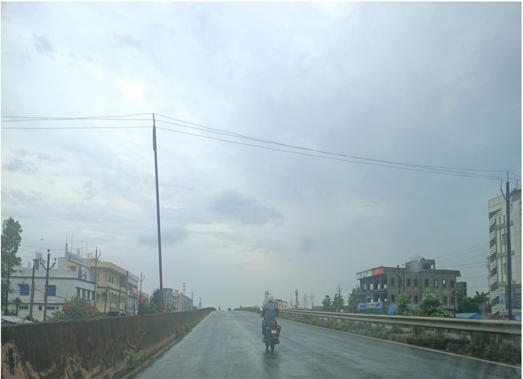
IMAGE: Bridge; Risk Level: High; Coordinates: 21.511436 , 86.892188