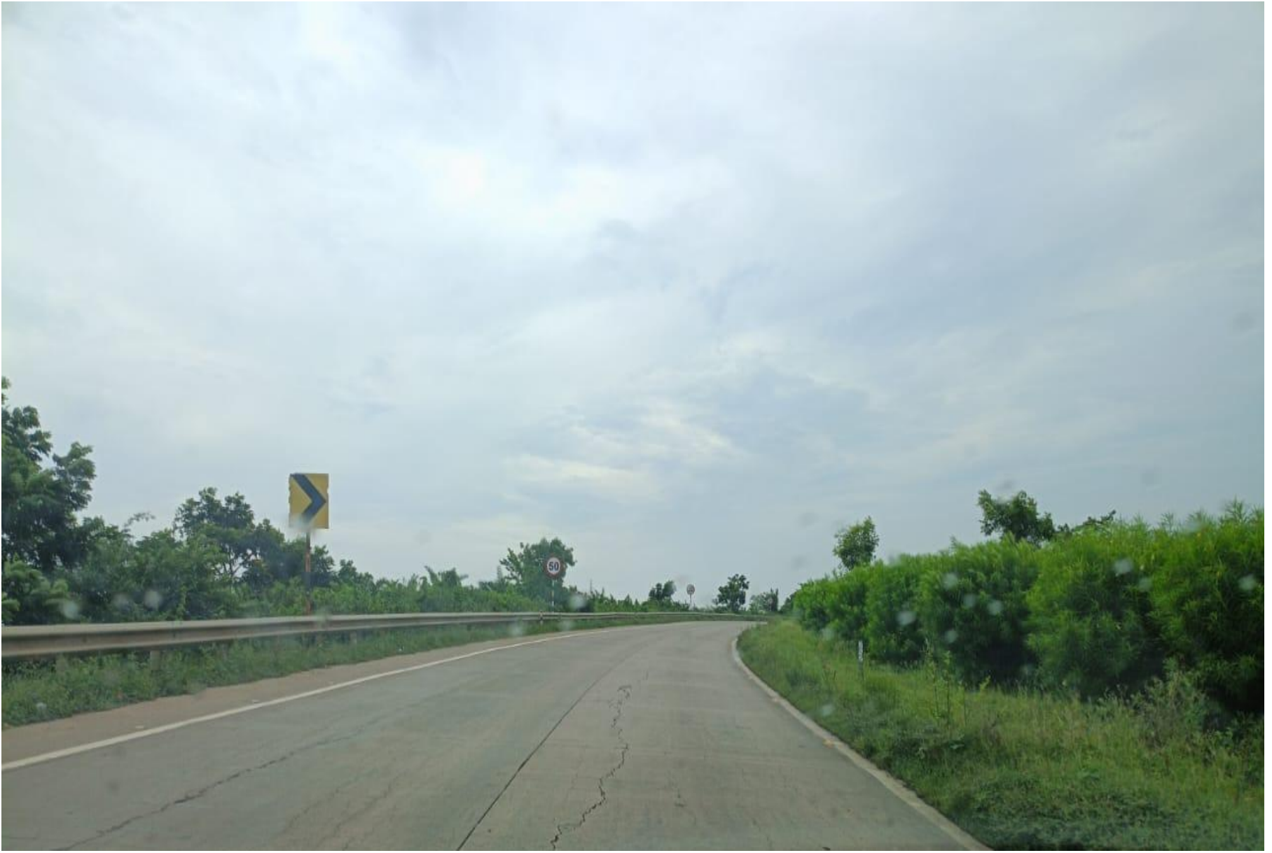
IMAGE: Sharp Right turn; Risk Level: High; Coordinates: 21.56232 , 86.986882