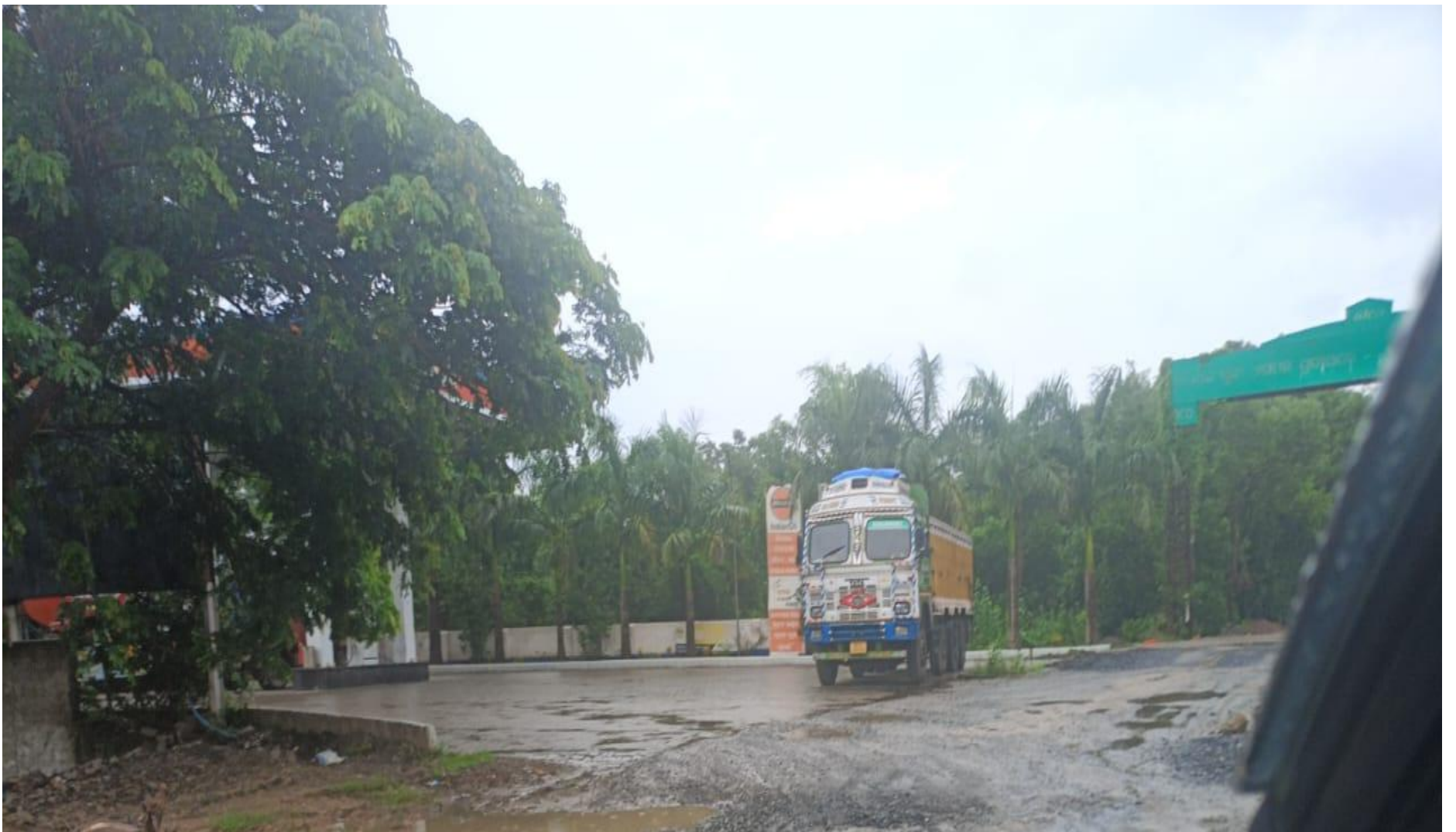
IMAGE: Sharp Right Turn; Risk Level: High; Coordinates: 21.491857 , 86.858955