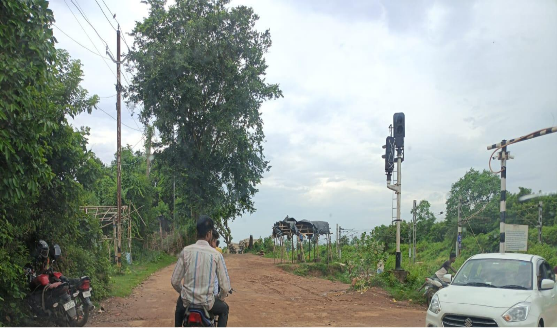
IMAGE: Sharp turn; Risk Level: High; Coordinates: 21.699036 , 87.060284