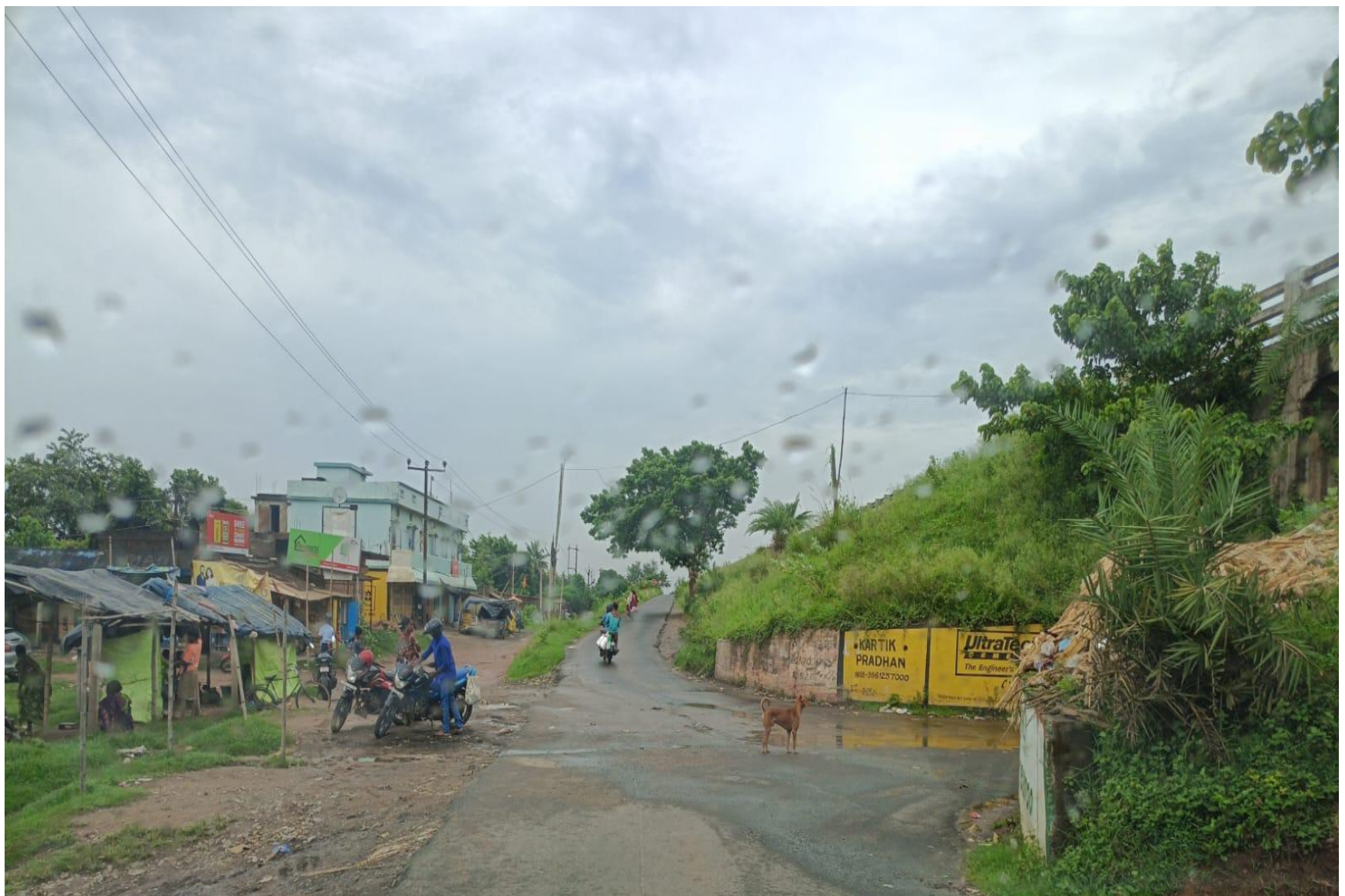
IMAGE: Sharp Right Turn; Risk Level: High; Coordinates: 21.5494 , 86.936415