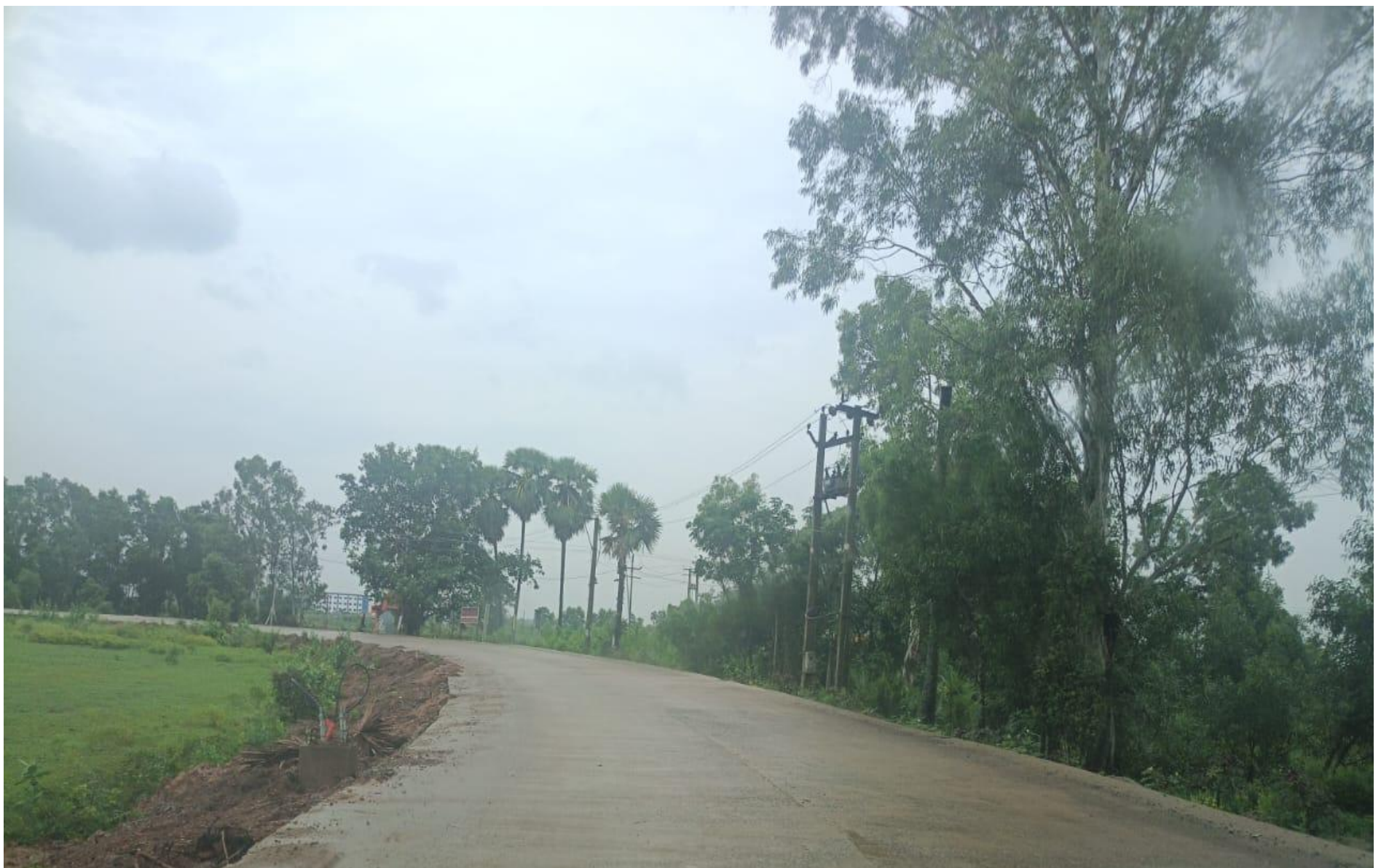
IMAGE: Sharp Left turn; Risk Level: High; Coordinates: 21.489892 , 86.861618