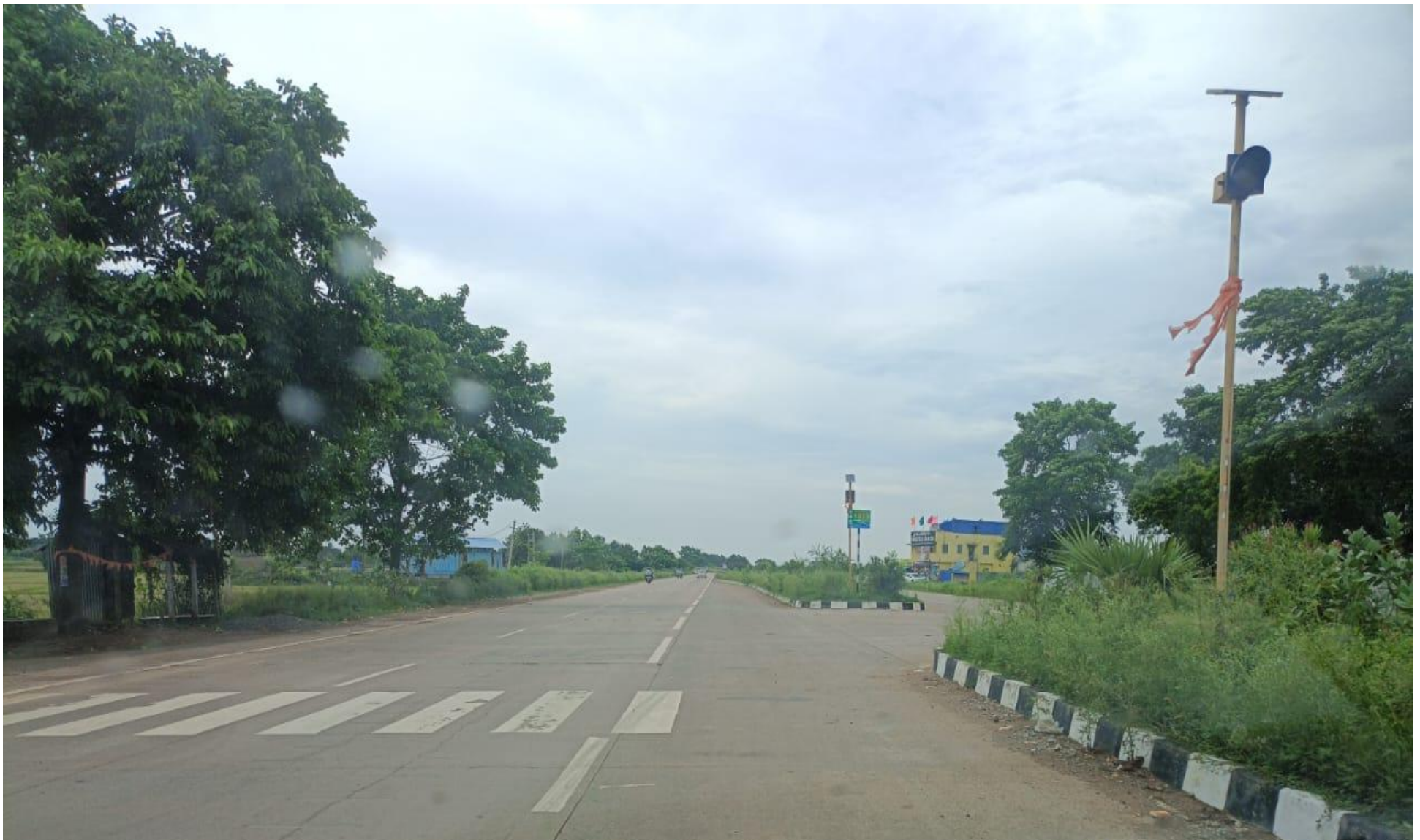
IMAGE: Sharp turn; Risk Level: High; Coordinates: 21.577171 , 87.009404