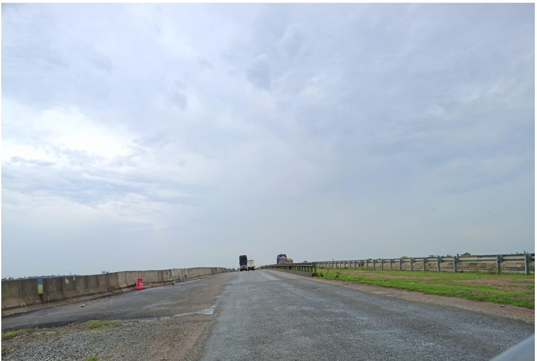
IMAGE: River Crossing ; Risk Level: High; Coordinates: 21.538488 , 86.90125