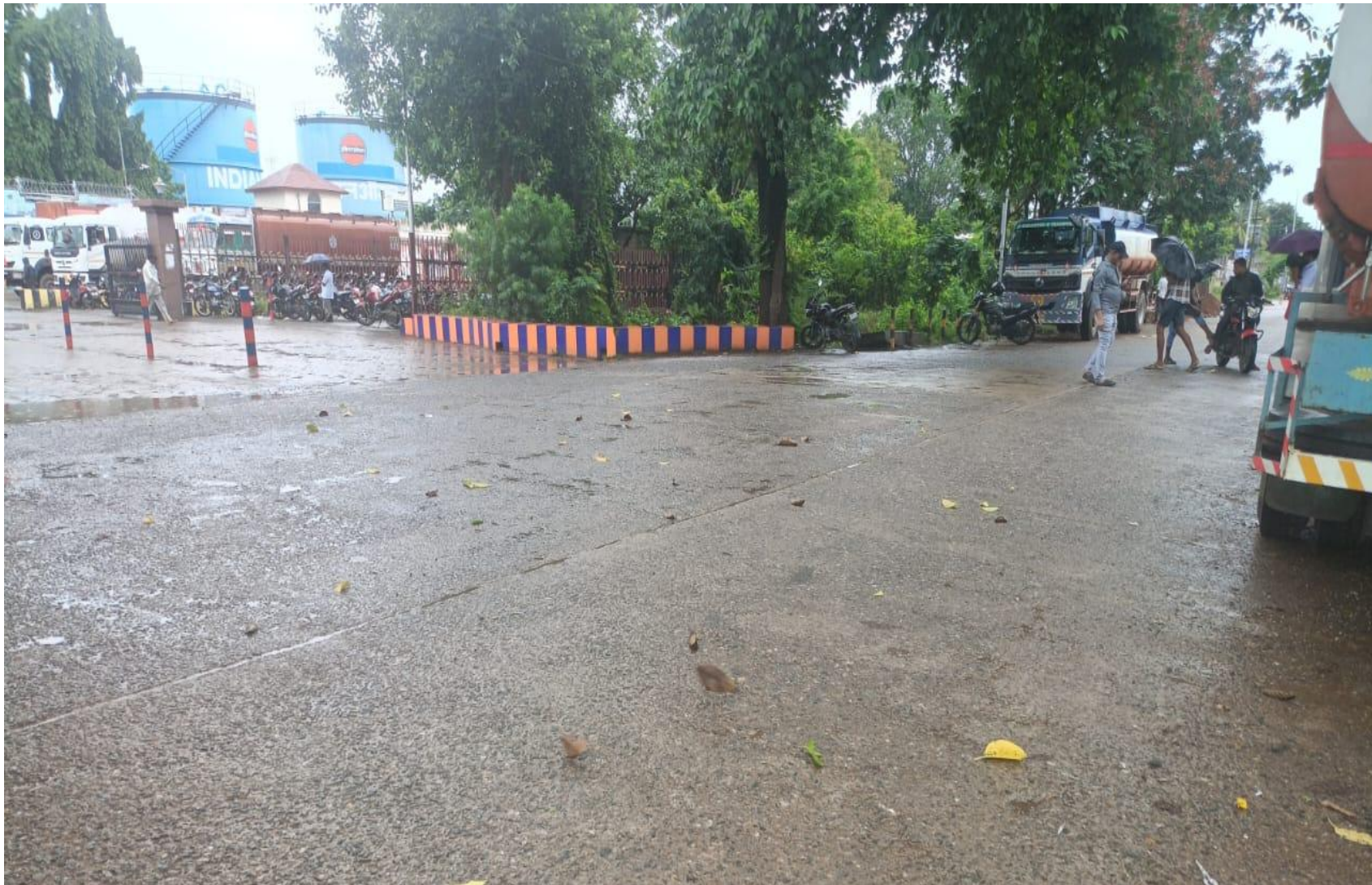
IMAGE: Sharp turn; Risk Level: High; Coordinates: 21.494395, 86.848456