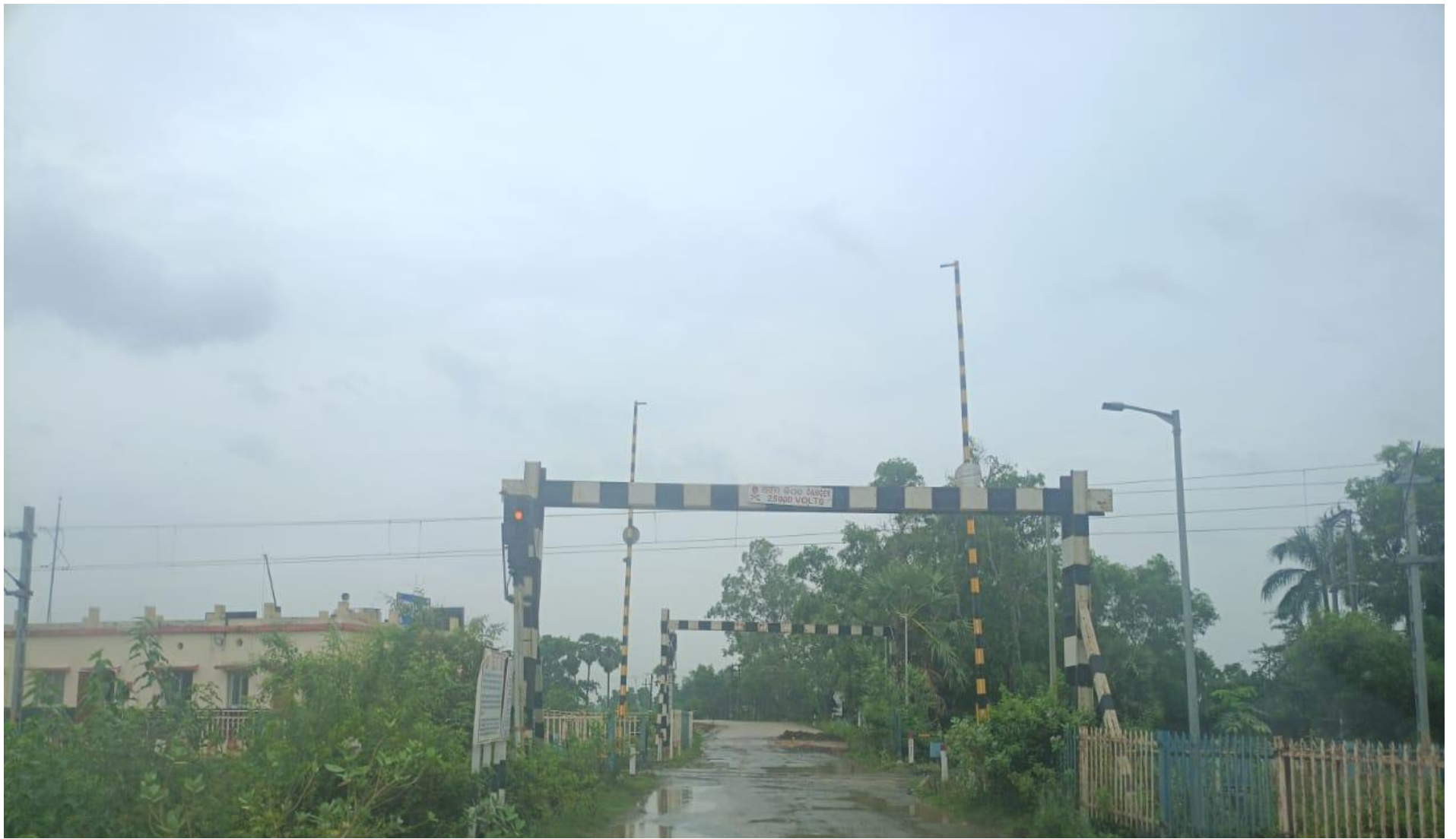
IMAGE: Crossing; Risk Level: High; Coordinates: 21.490679 , 86.861366