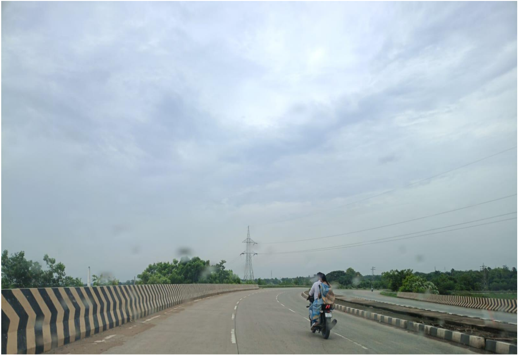
IMAGE: Right turn; Risk Level: Medium; Coordinates: 21.551086 , 86.924864