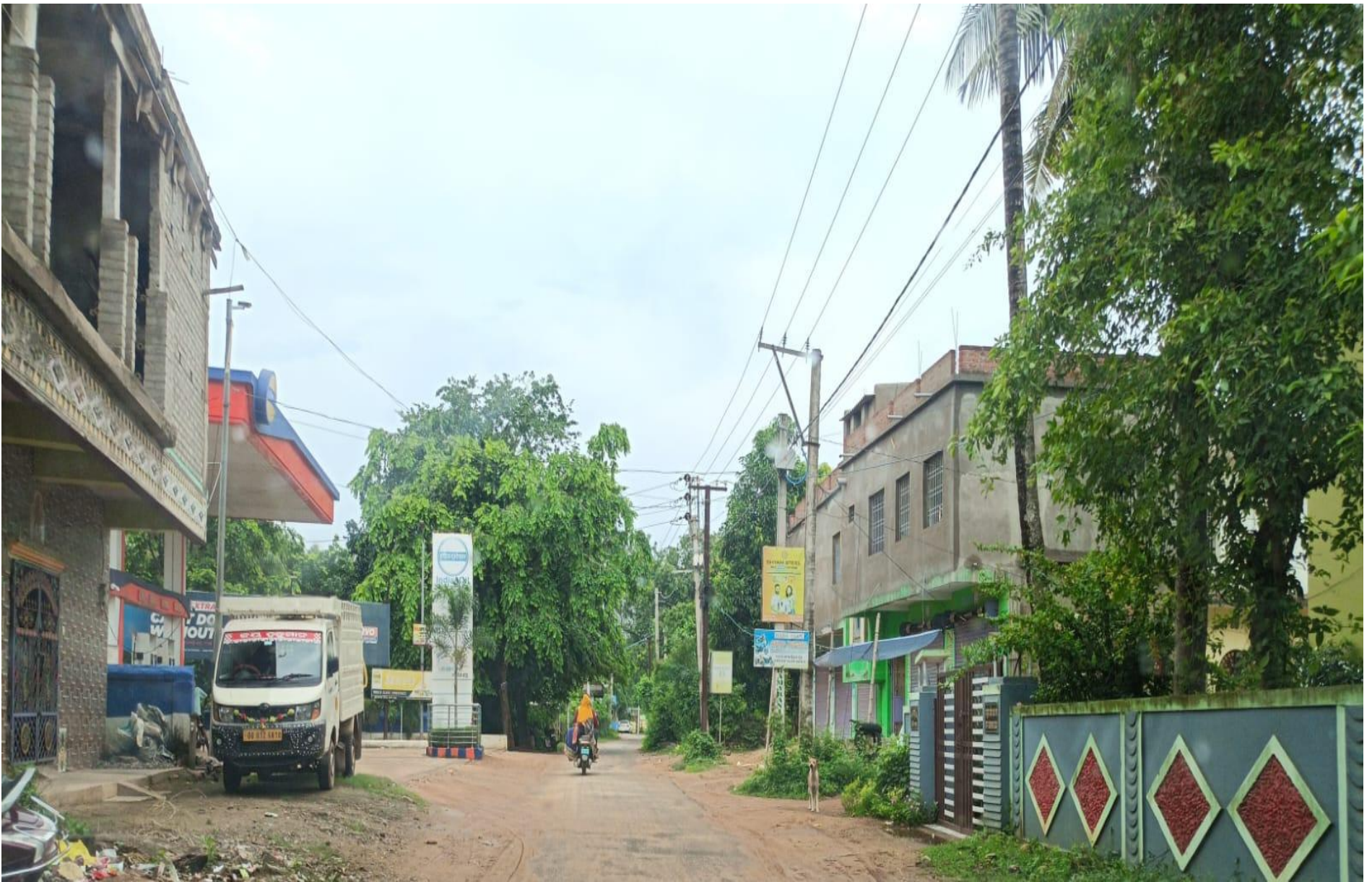
IMAGE: Sharp turn; Risk Level: High; Coordinates: 21.70323 , 87.05491

The comprehensive Journey Risk Management (JRM) study has provided an in-depth analysis of the route from start to end, highlighting critical risk points, recommended speeds, and potential hazards. By leveraging advanced technologies and data-driven insights, this report aims to enhance safety and preparedness for hazardous material transportation, ensuring a secure and efficient journey.