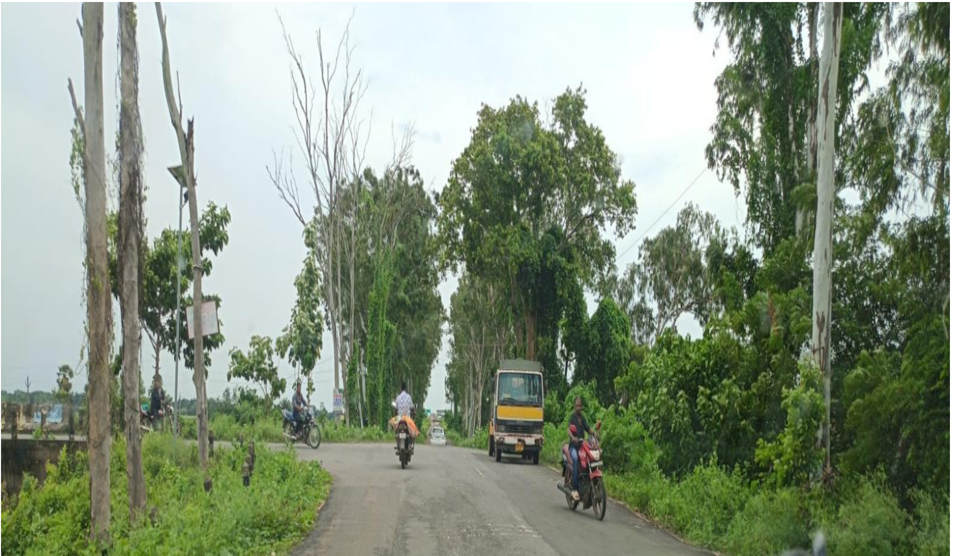
IMAGE: Sharp Left turn; Risk Level: High; Coordinates: 21.688015 , 87.073371