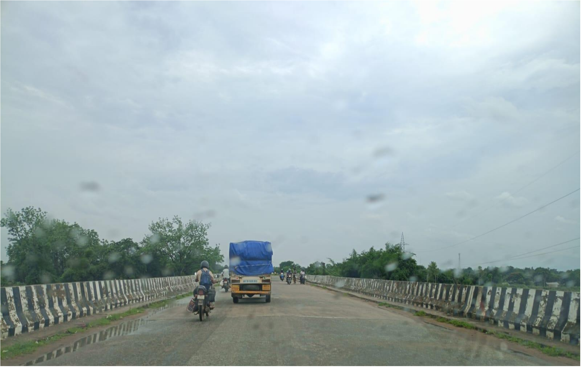
IMAGE: Sharp turn; Risk Level: High; Coordinates: 21.544707 , 86.93396