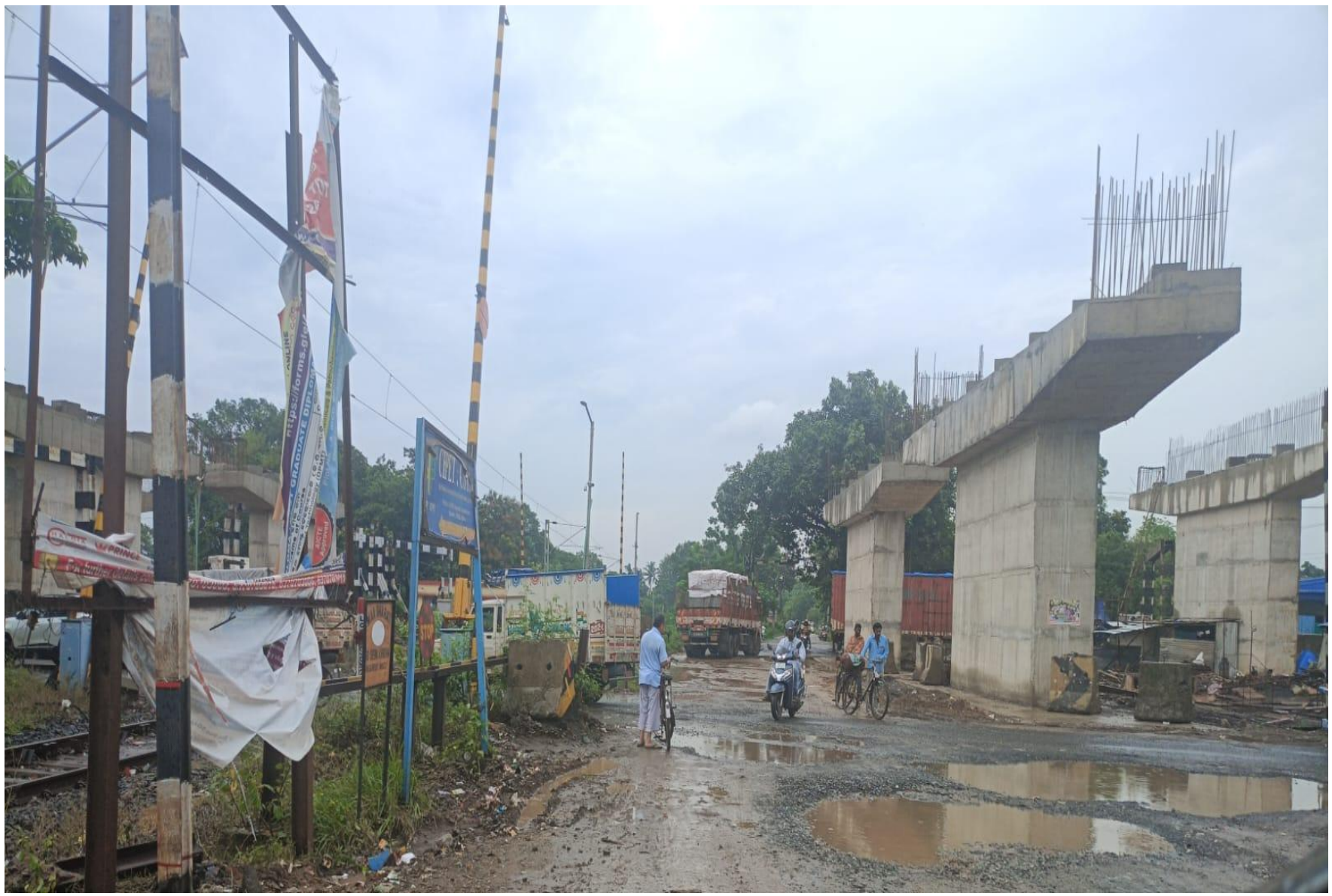
IMAGE: Sharp turn Left; Risk Level: High; Coordinates: 21.493375 , 86.888745