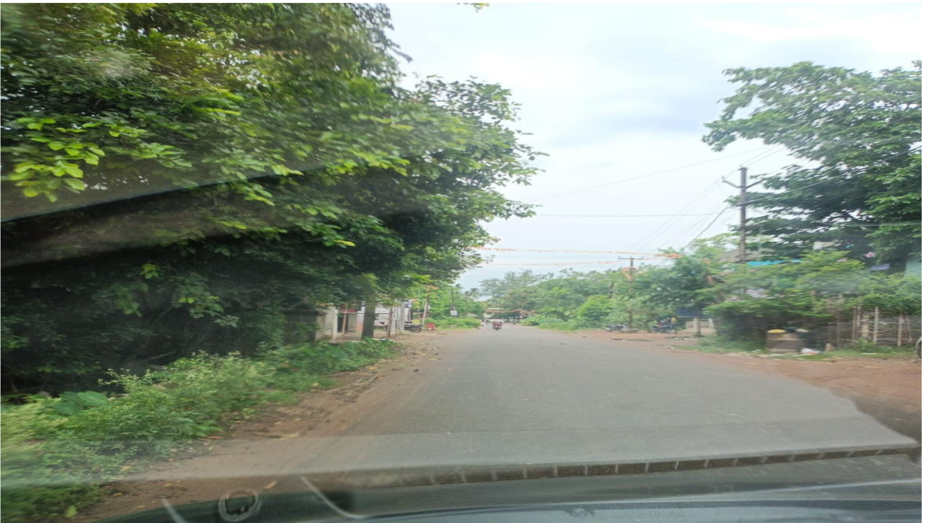
IMAGE: Sharp turn; Risk Level: High; Coordinates: 21.692898 , 87.070133