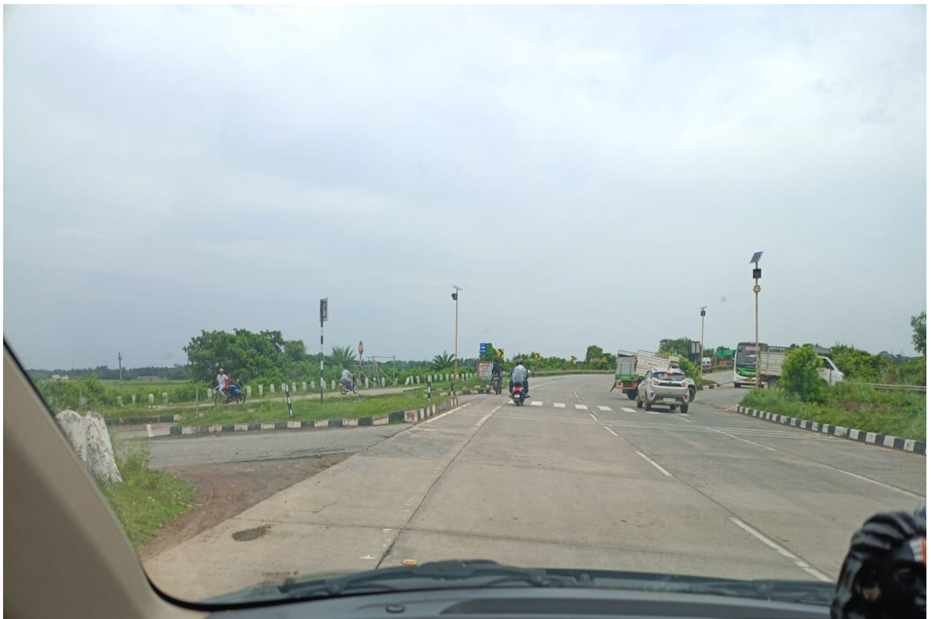
IMAGE: Sharp Left turn; Risk Level: High; Coordinates: 21.69026 , 87.076617