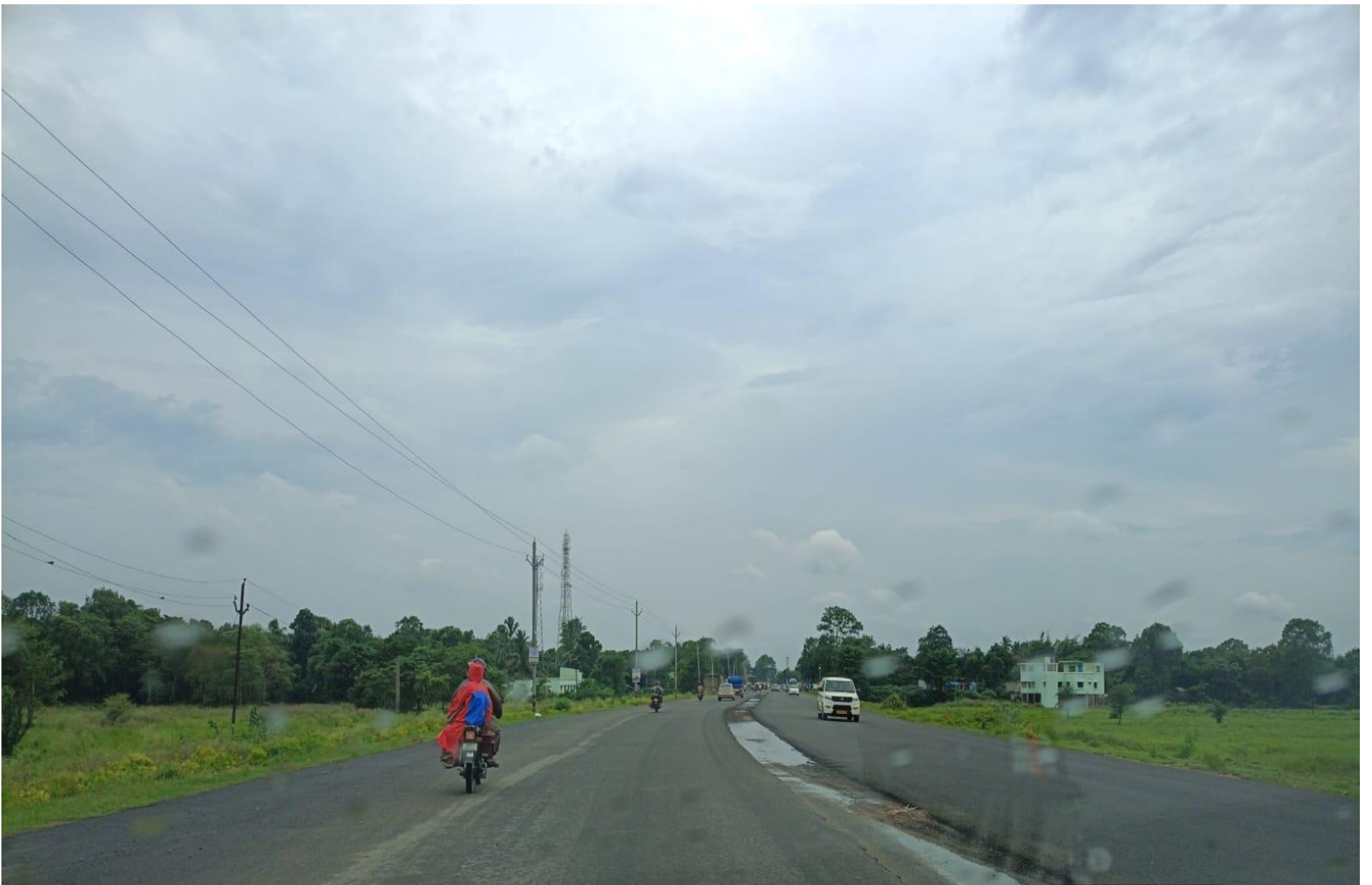
IMAGE: Right turn; Risk Level: Medium; Coordinates: 21.5385 , 86.931403