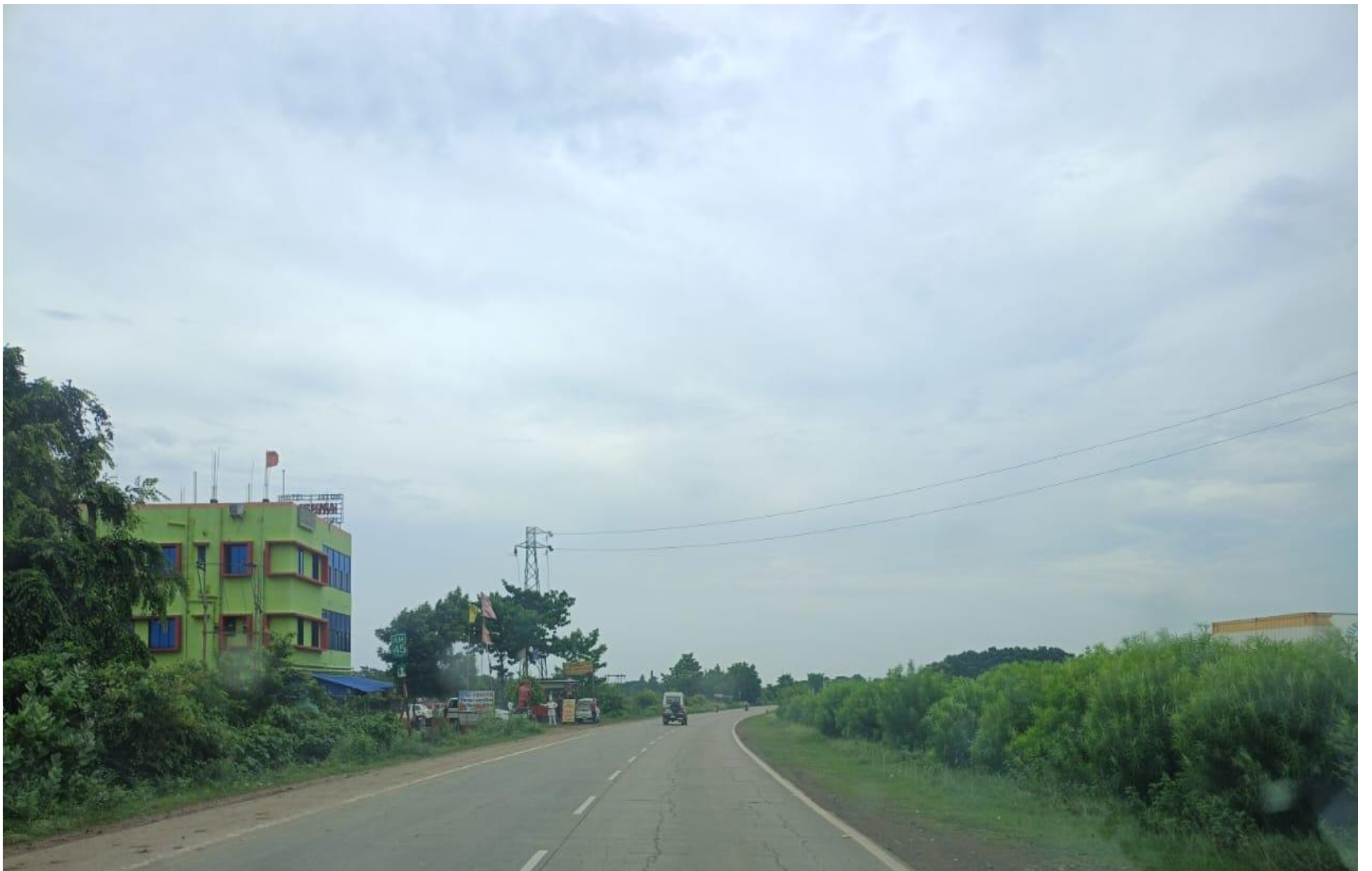
IMAGE: Right turn; Risk Level: Medium; Coordinates: 21.566188 , 86.995442