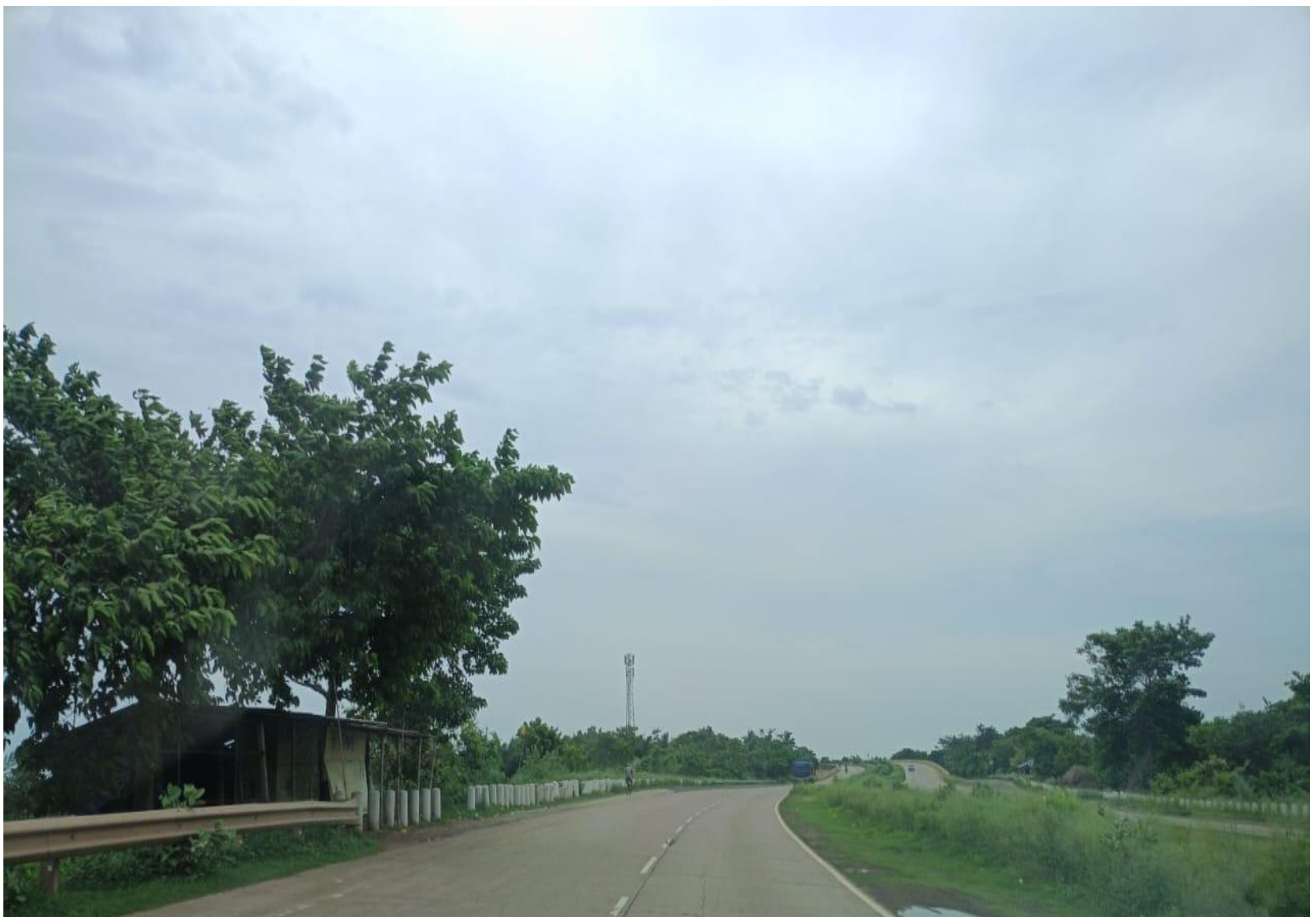
IMAGE: Turn; Risk Level: MEDIUM; Coordinates: 21.632356 , 87.048206