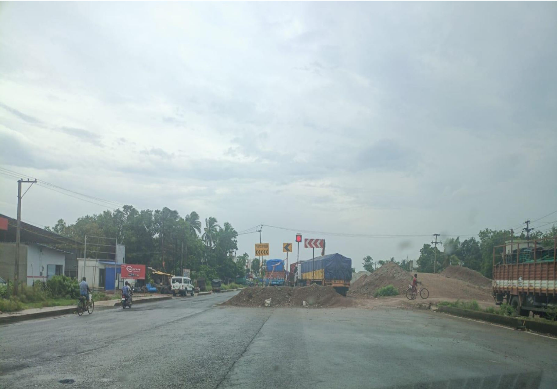
IMAGE: Sharp Left turn; Risk Level: High; Coordinates: 21.525135 , 86.895252