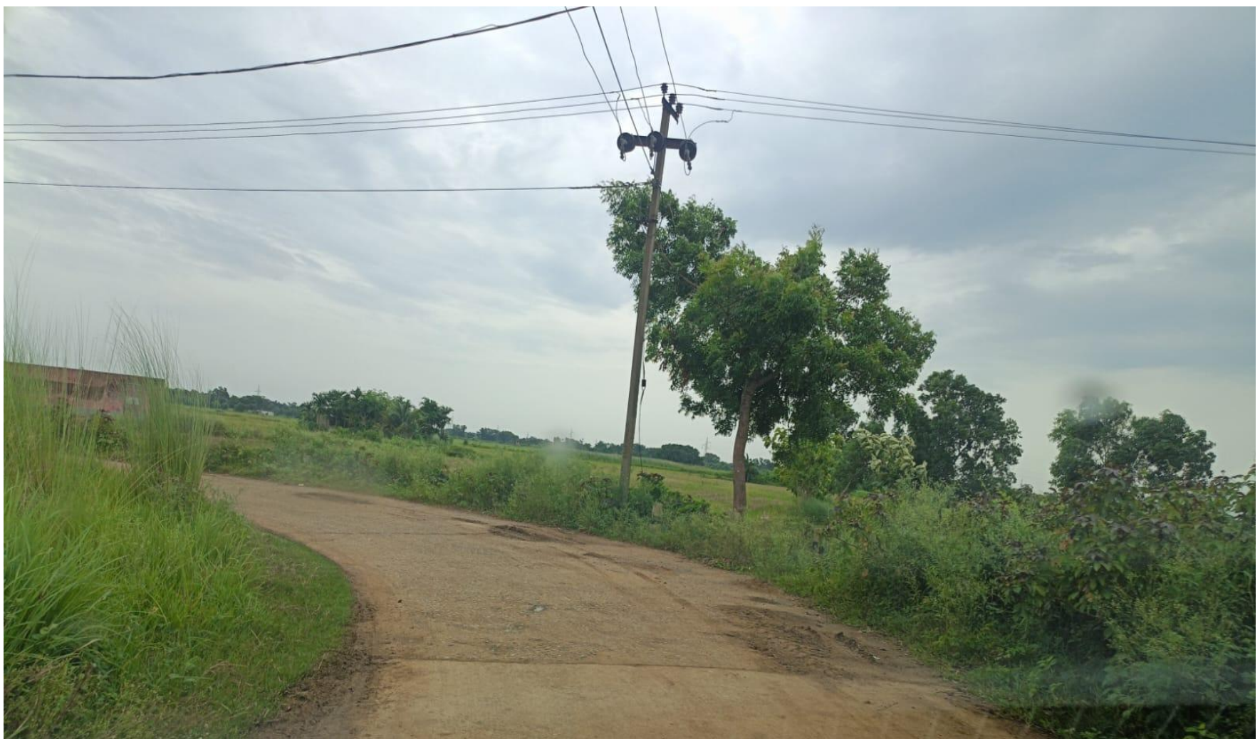
IMAGE: SHARP TURN LEFT ; Risk Level: High ; Coordinates: 21.789023, 87.22152