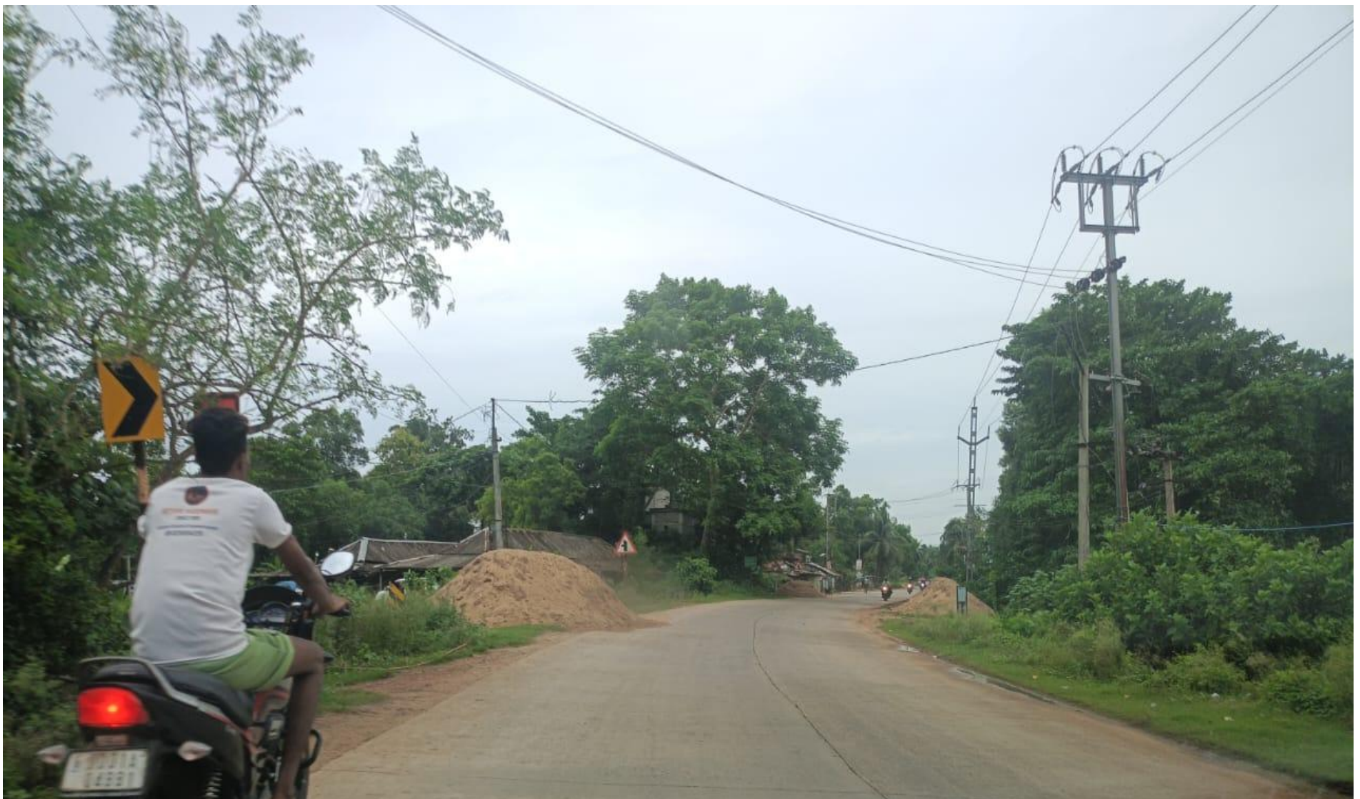
IMAGE: SHARP TURN ; Risk Level: Medium ; Coordinates: 21.743591, 87.384082