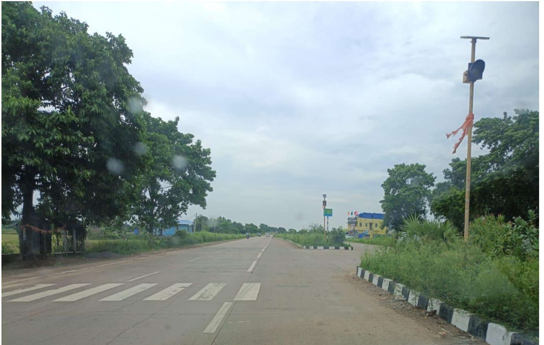
IMAGE: SHARP TURN RIGHT Risk Level: High ; Coordinates: 21.577171, 87.009404