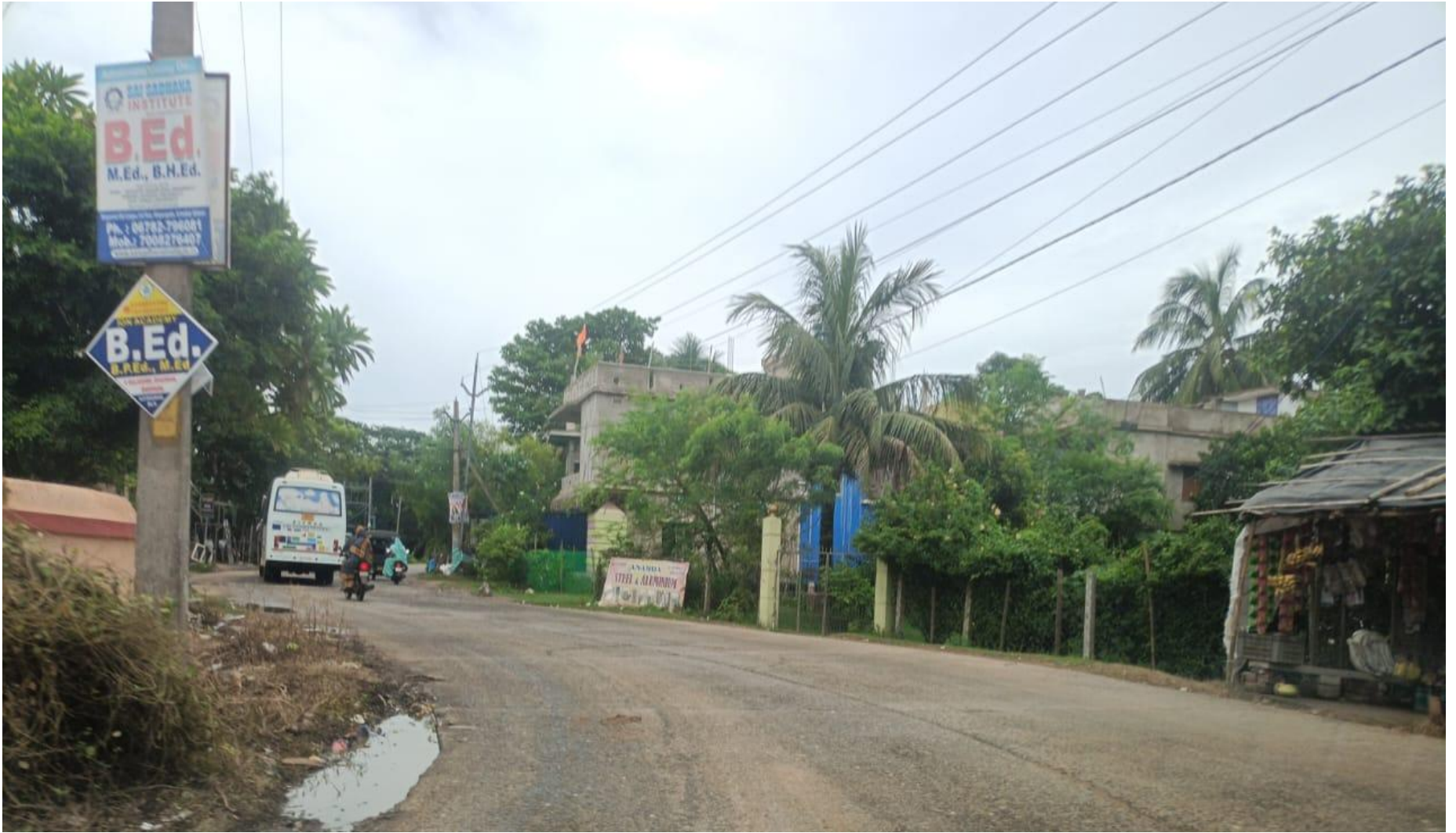
IMAGE: SHARP TURN ; Risk Level: Medium ; Coordinates: 21.752308, 87.365732