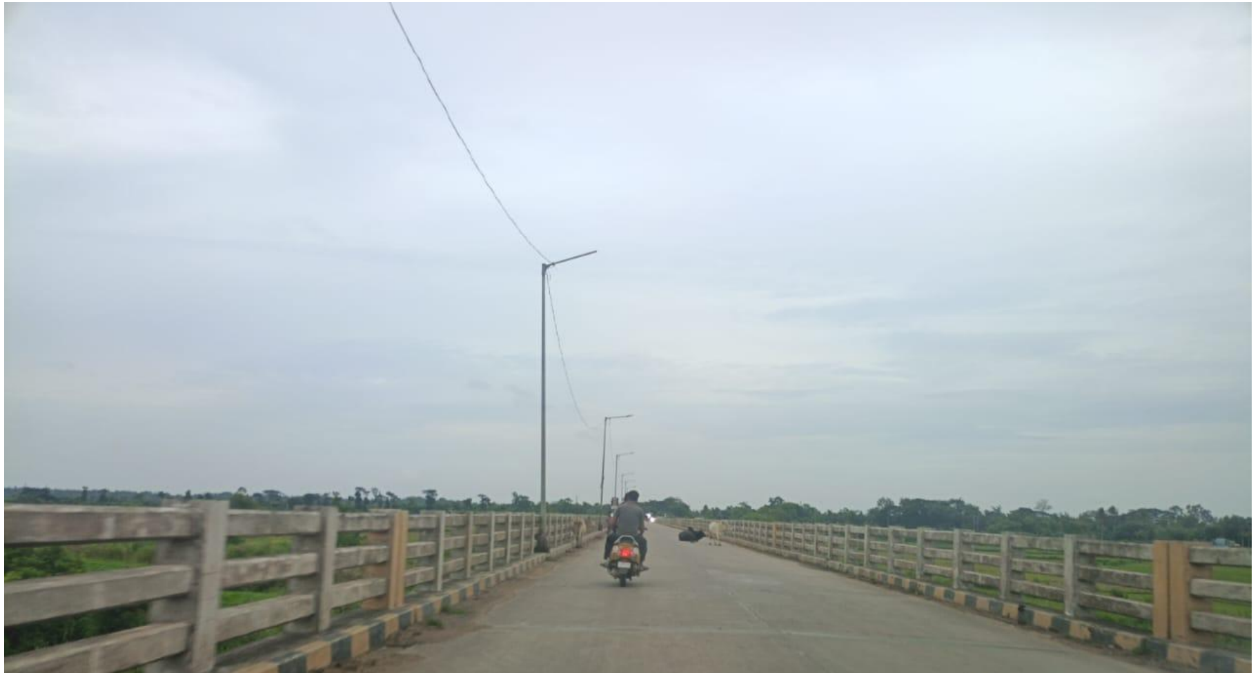
IMAGE: BRIDGE ; Risk Level: High ; Coordinates: 21.700371, 87.409532