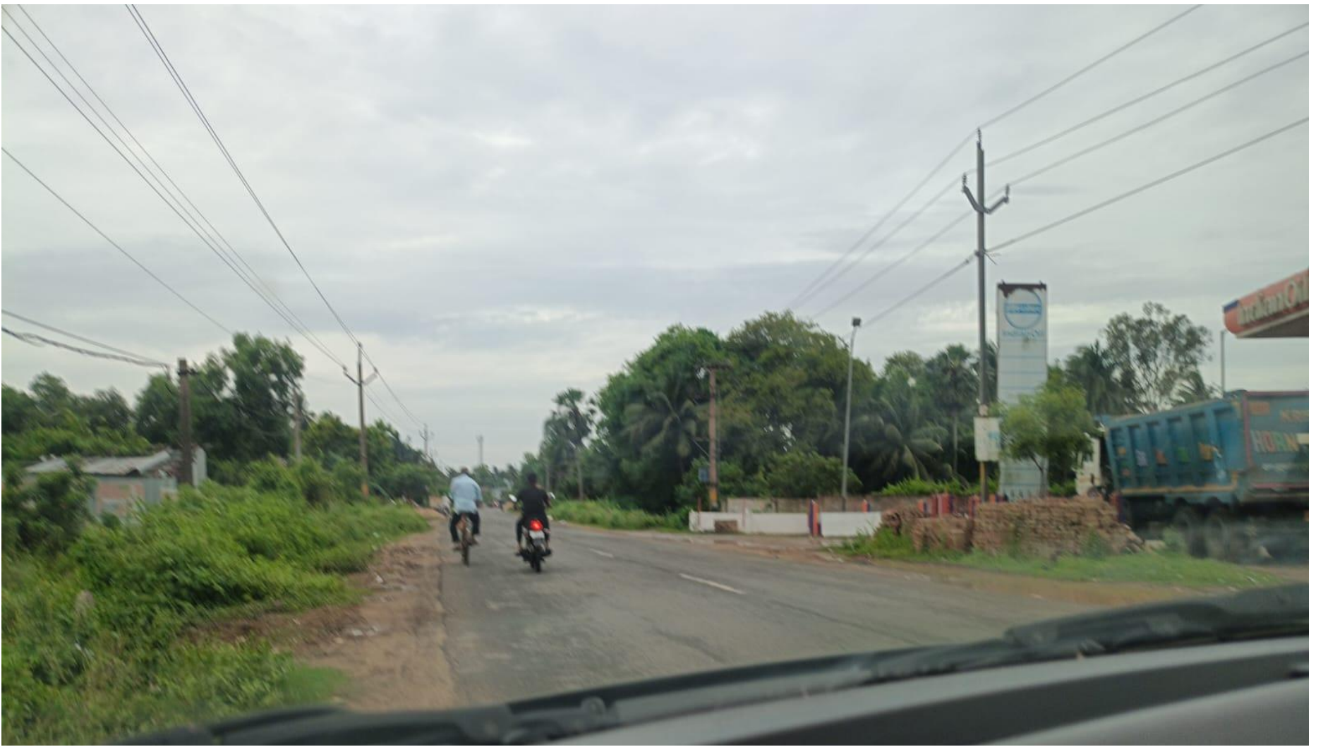
IMAGE: SHARP TURN ; Risk Level: High ; Coordinates: 21.640885, 87.449223