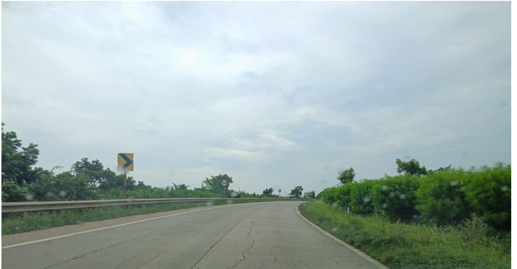
IMAGE: TURN RIGHT ; Risk Level: Medium ; Coordinates: 21.56232, 86.986882