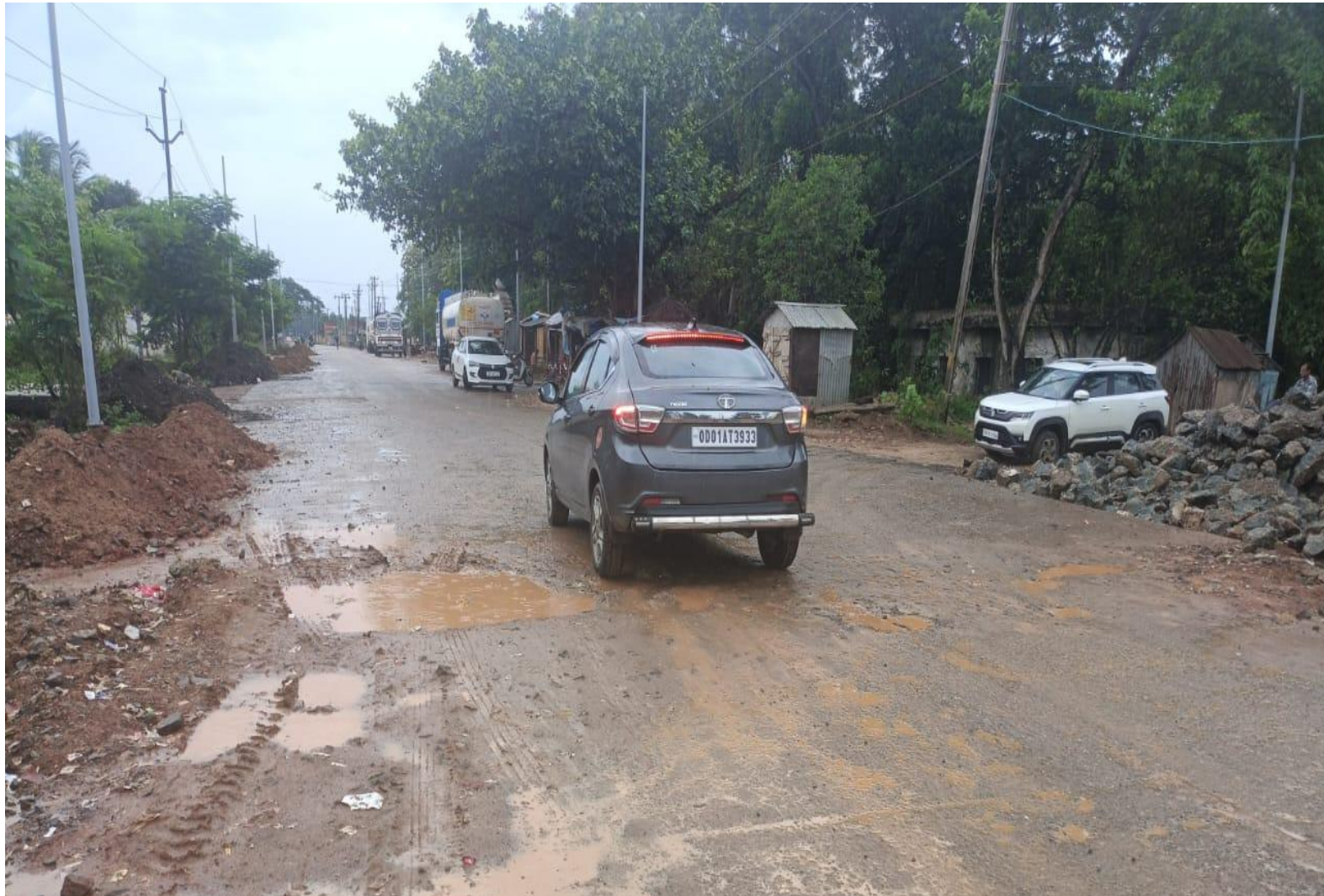
IMAGE: SHARP TURN RIGHT ; Risk Level: High ; Coordinates: 21.495242, 86.84884