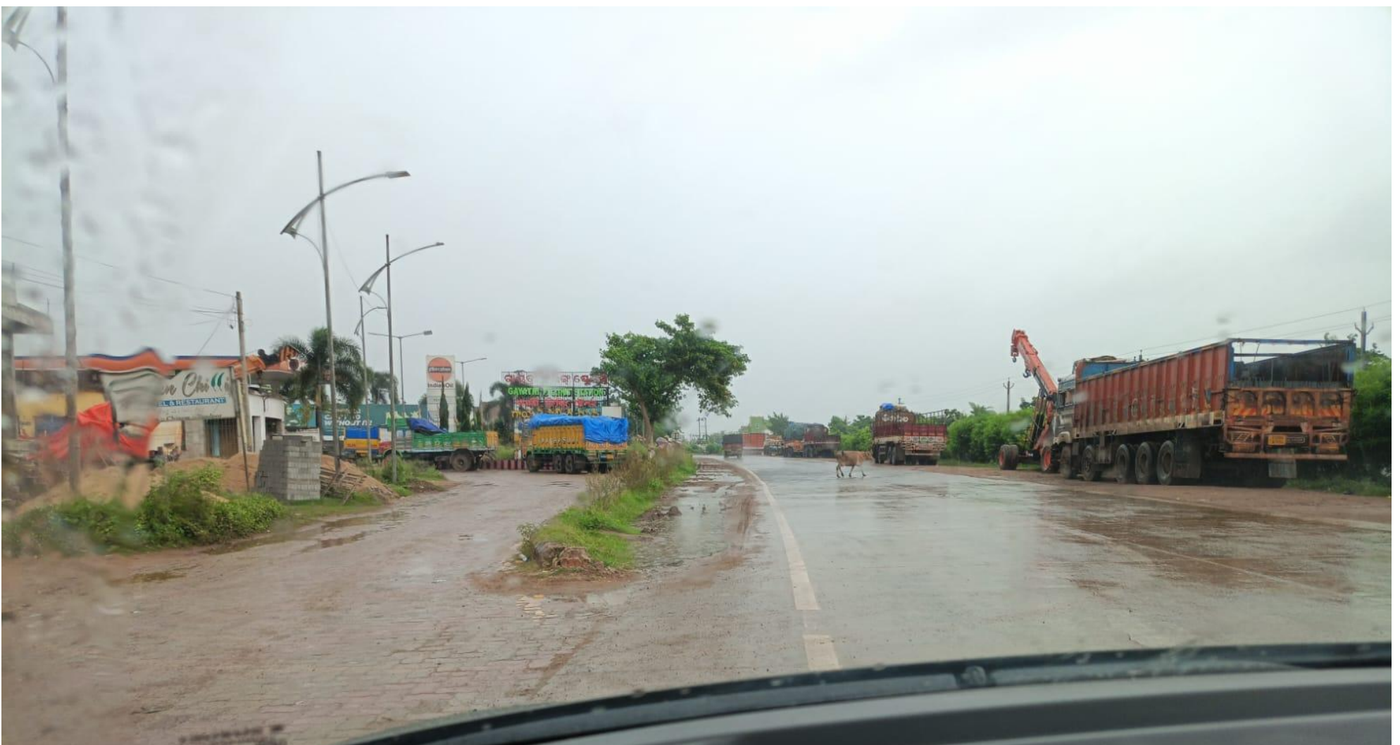
IMAGE: STRAIGHT ; Risk Level: Medium ; Coordinates: 21.799878, 87.243923