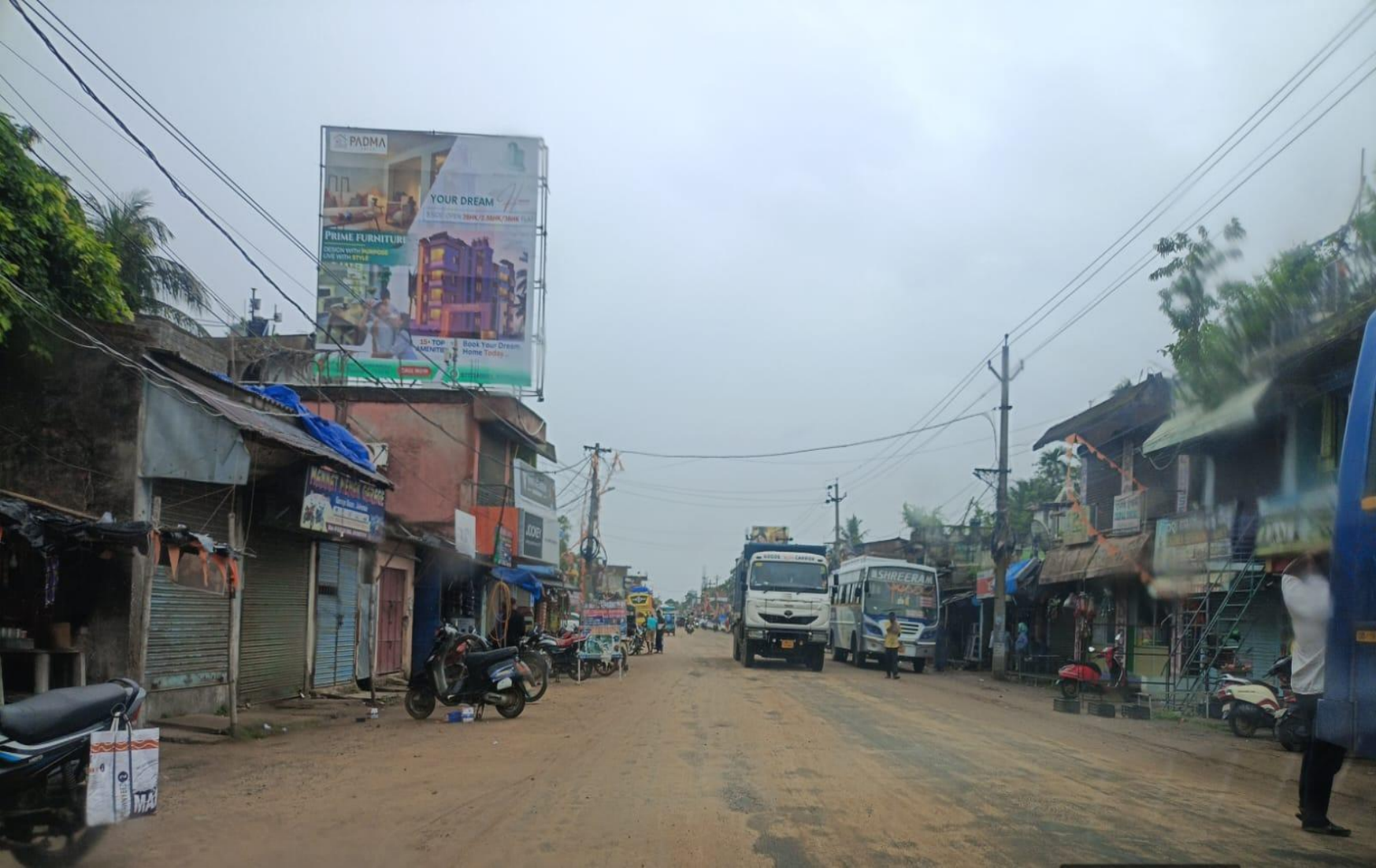
IMAGE: STRAIGHT ; Risk Level: Medium ; Coordinates: 21.796878, 87.217582