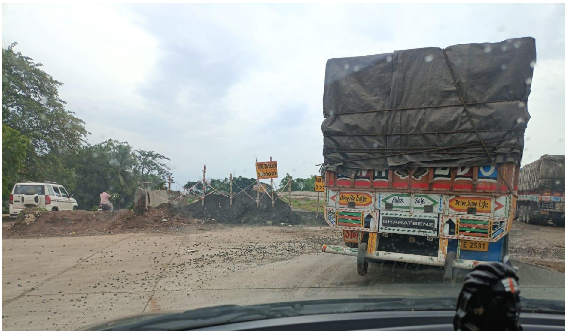
IMAGE: SHARP TURN RIGHT ; Risk Level: High ; Coordinates: 21.747276, 87.149108