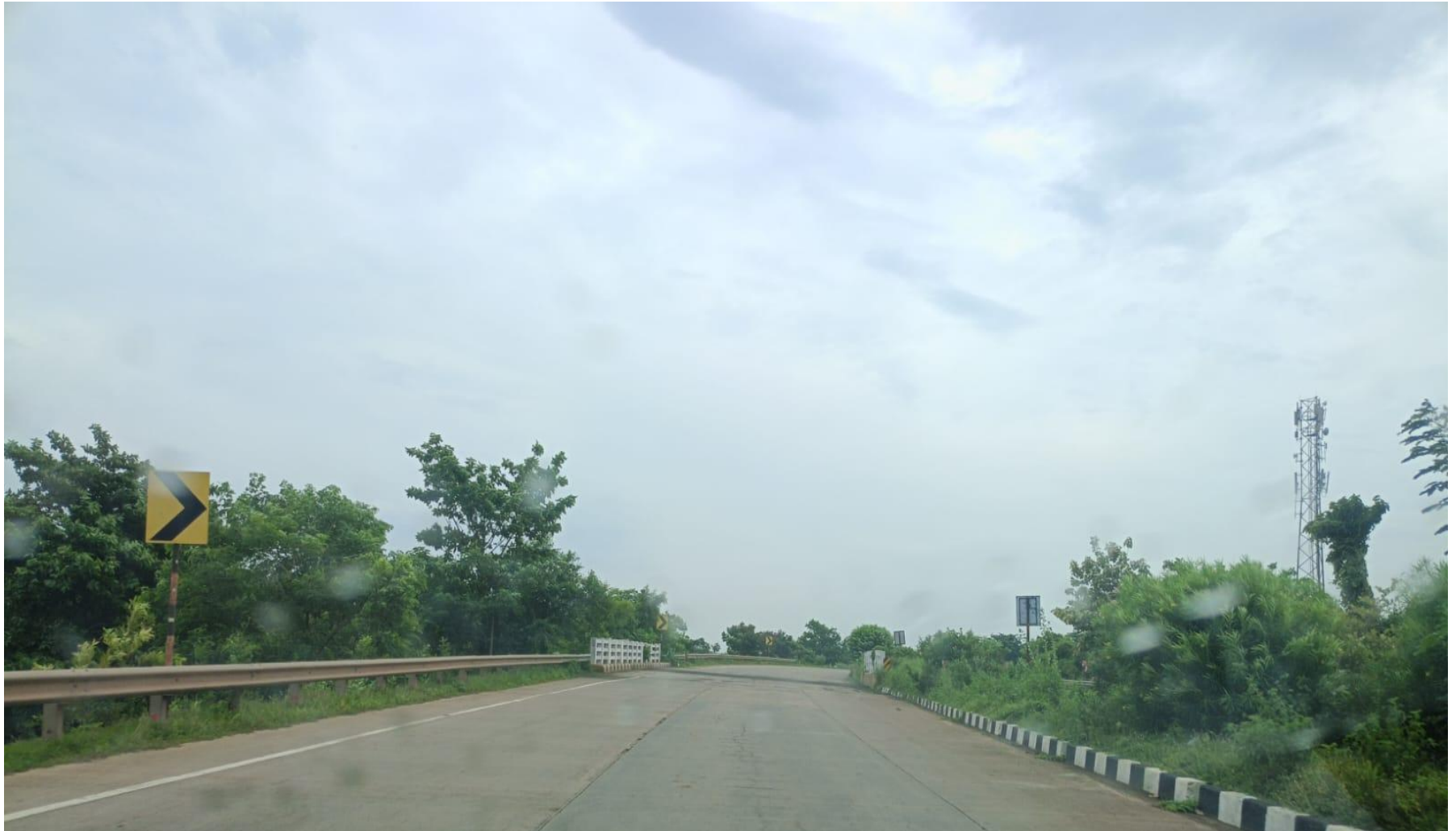
IMAGE: TURN RIGHT ; Risk Level: Medium ; Coordinates: 21.719139, 87.112632