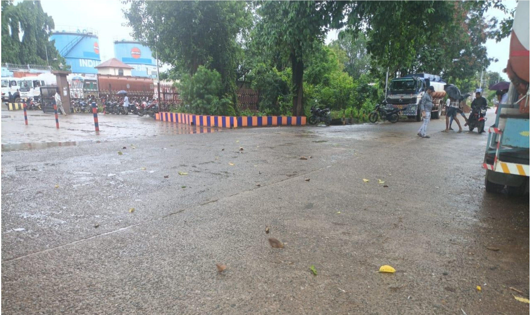
IMAGE: SHARP TURN LEFT ; Risk Level: High ; Coordinates: 21.494395, 86.848456