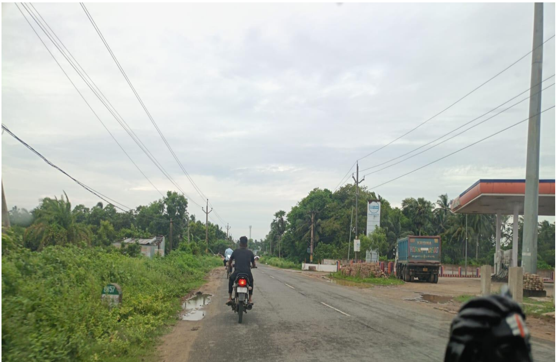
IMAGE: SHARP TURN ; Risk Level: High ; Coordinates: 21.641097, 87.449109