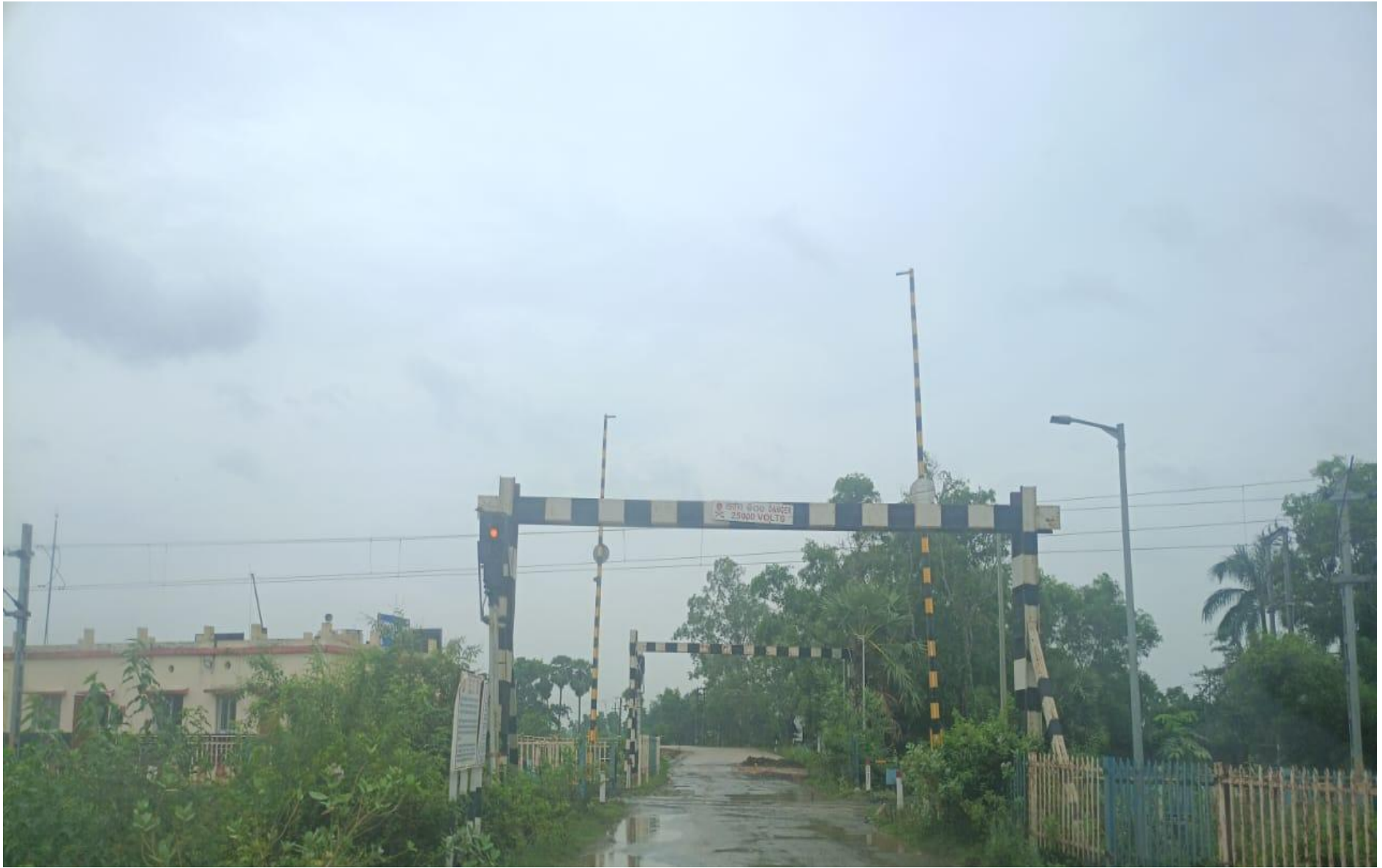
IMAGE: CROSSING ; Risk Level: High ; Coordinates: 21.490679, 86.861366