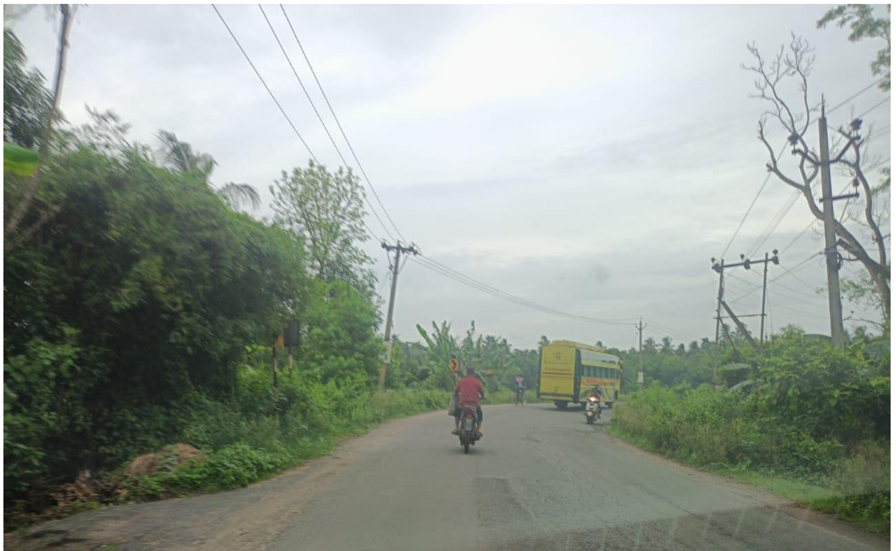
IMAGE: SHARP TURN RIGHT ; Risk Level: High ; Coordinates: 21.67728, 87.424913