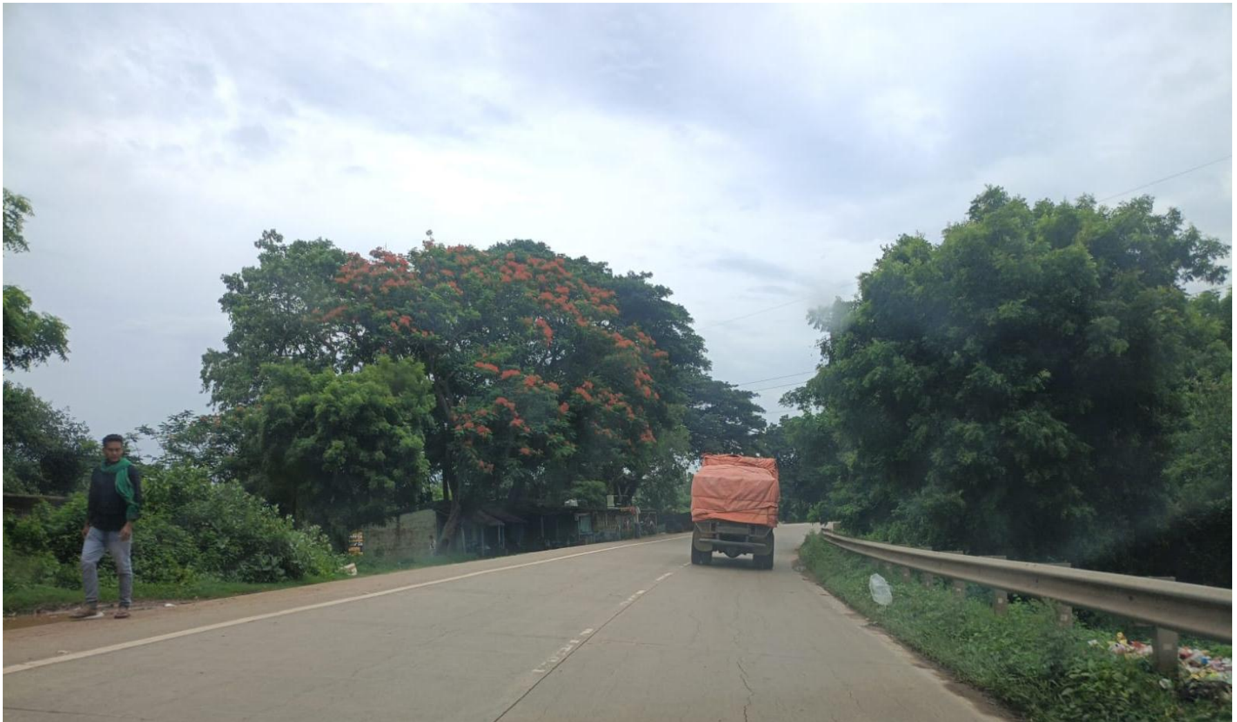
IMAGE: TURN RIGHT ; Risk Level: MEDIUM ; Coordinates: 21.761587, 87.155152