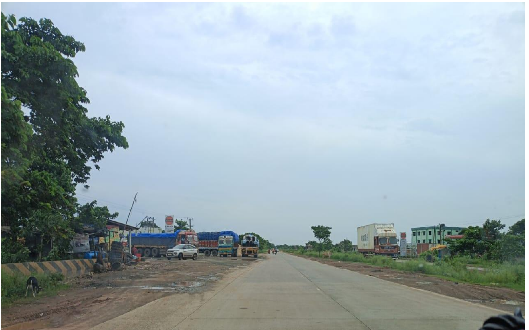
IMAGE: STRAIGHT ; Risk Level: Medium ; Coordinates: 21.656367, 87.060989