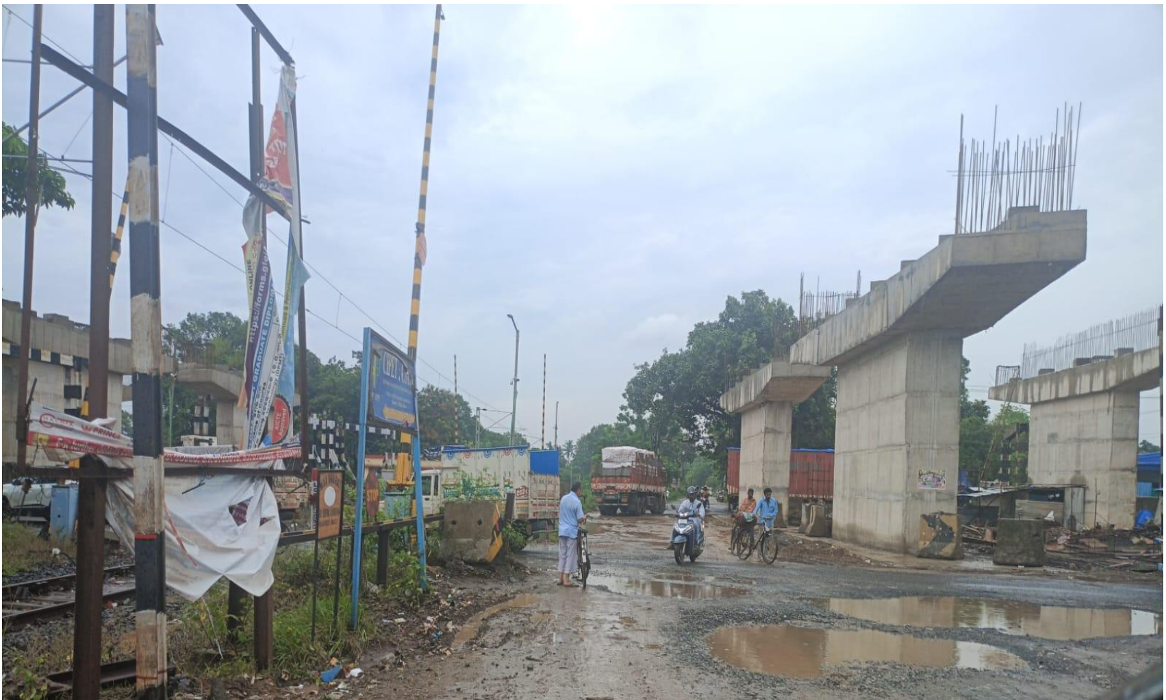
IMAGE: SHARP TURN LEFT ; Risk Level: High ; Coordinates: 21.493375, 86.888745