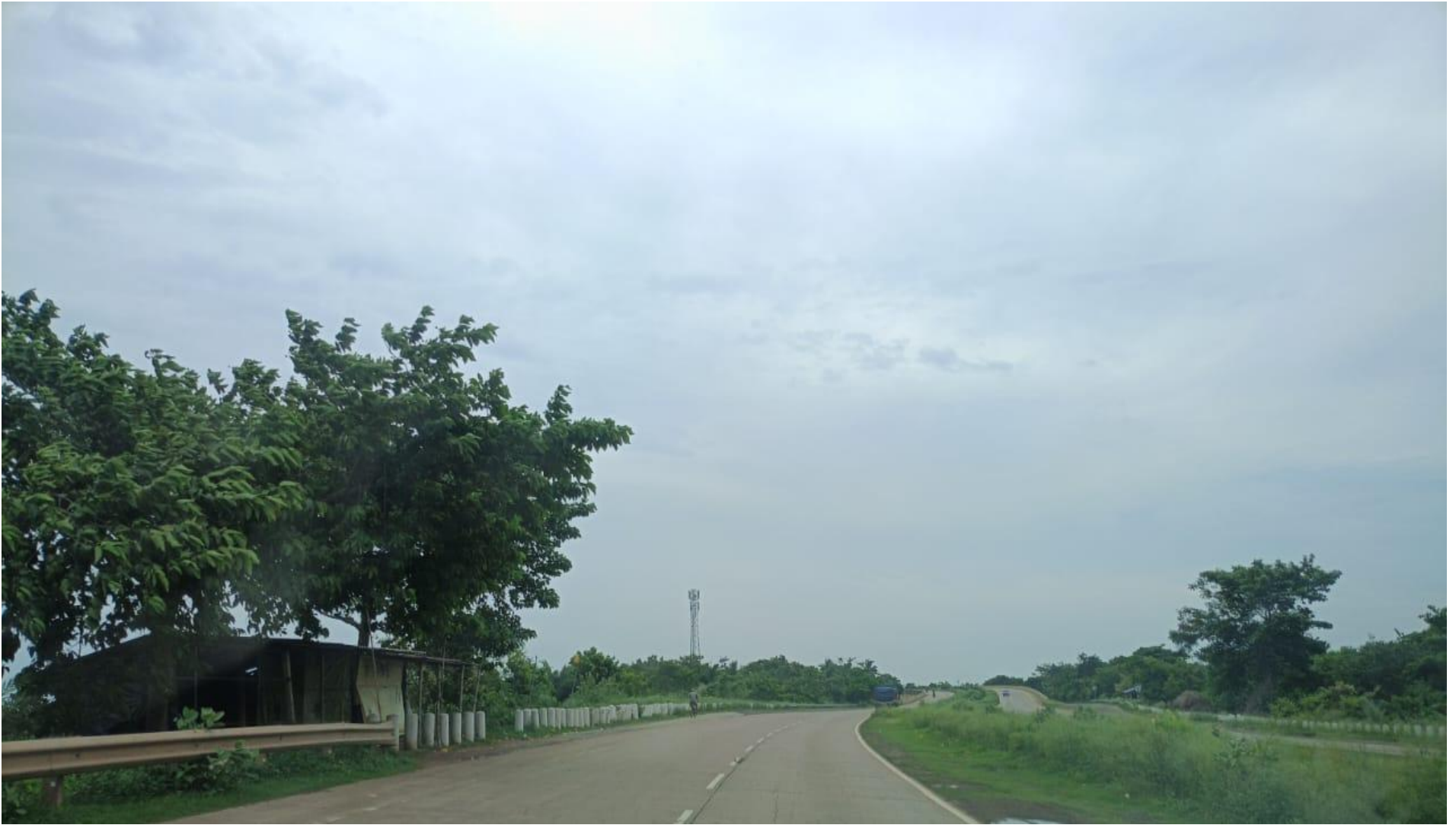
IMAGE: TURN RIGHT ; Risk Level: Medium ; Coordinates: 21.632356, 87.048206