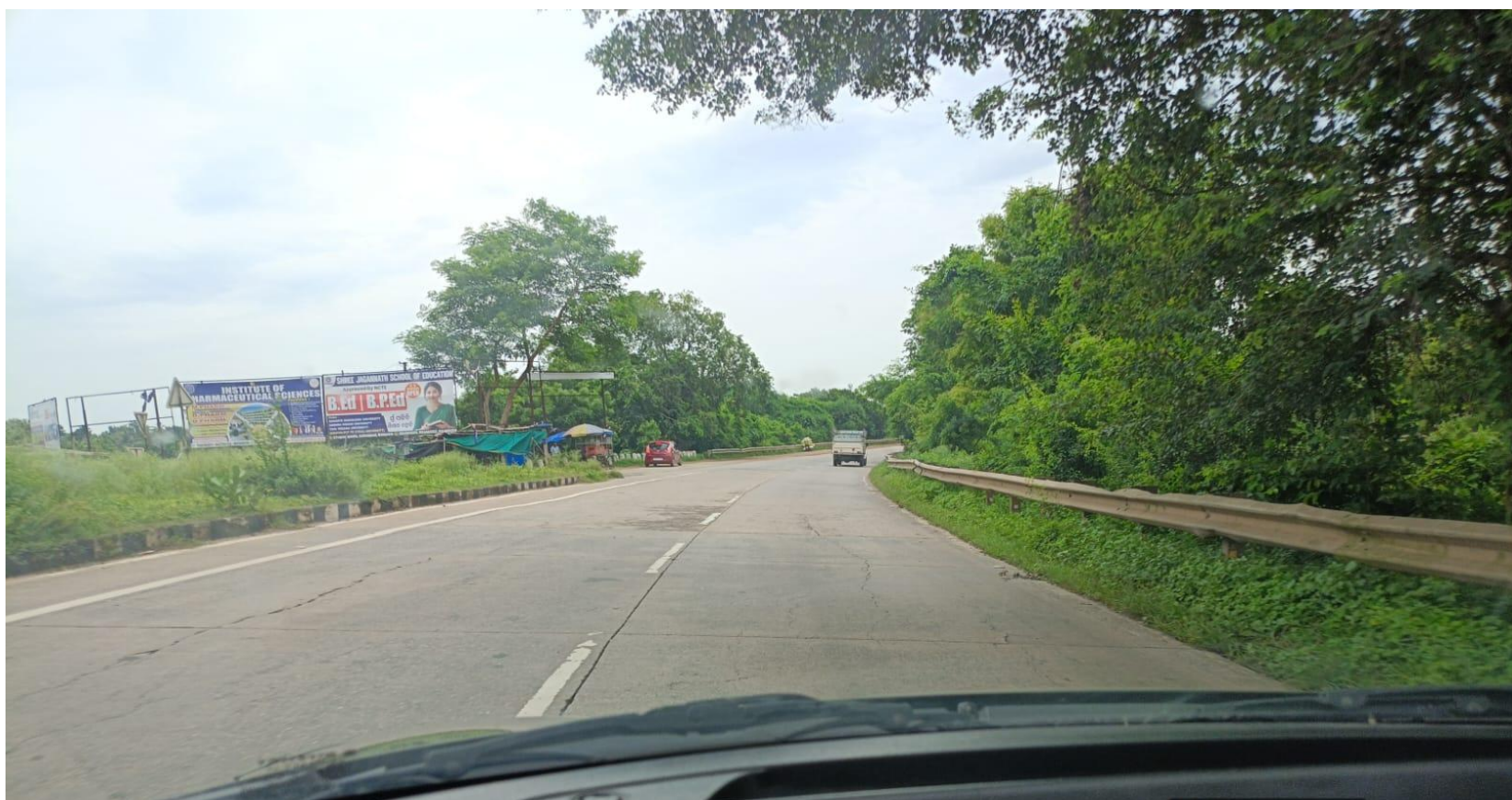
IMAGE: TURN RIGHT ; Risk Level: MEDIUM ; Coordinates: 21.766892, 87.169426