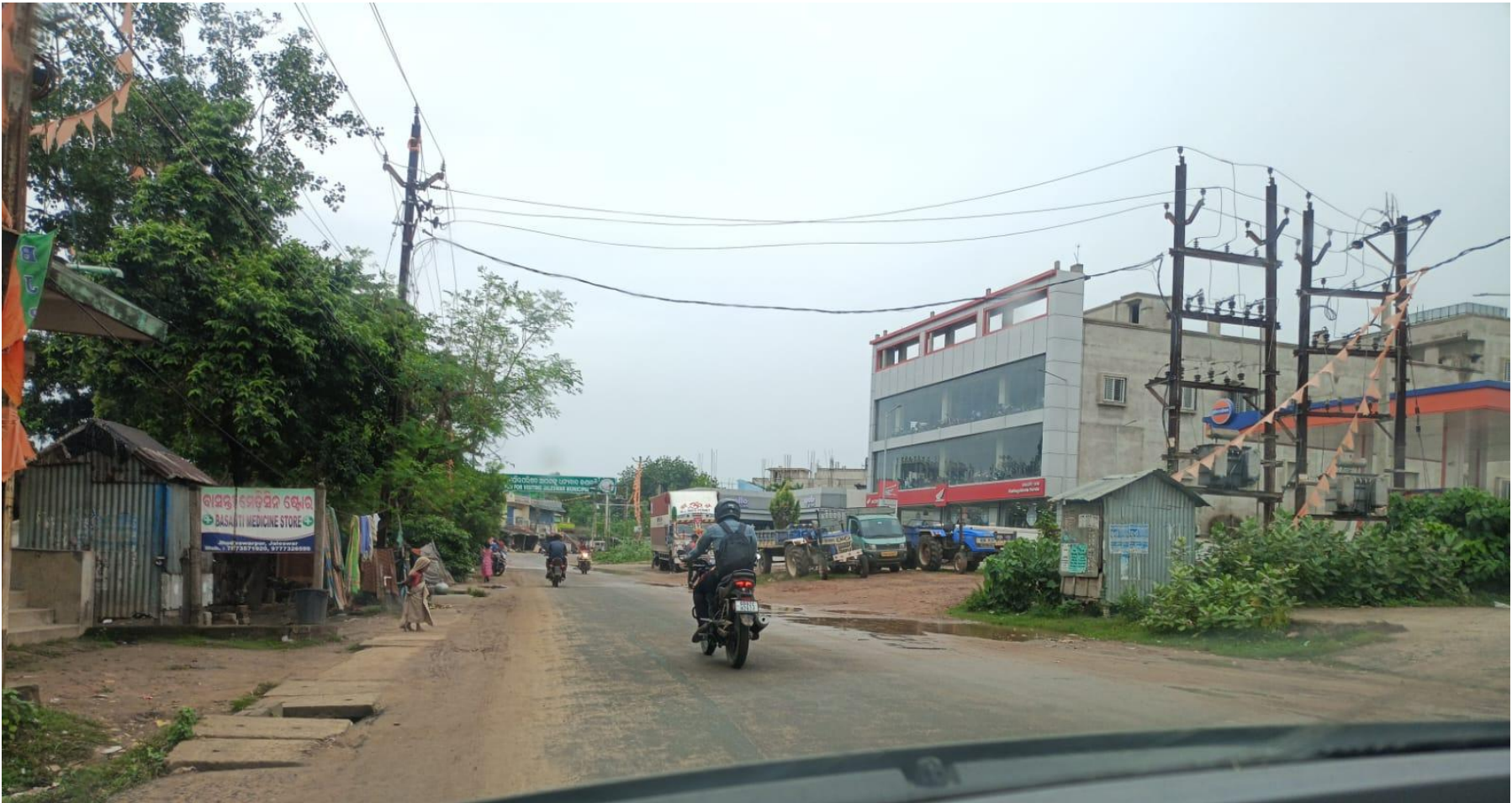
IMAGE: STRAIGHT ; Risk Level: Medium ; Coordinates: 21.795304, 87.215255