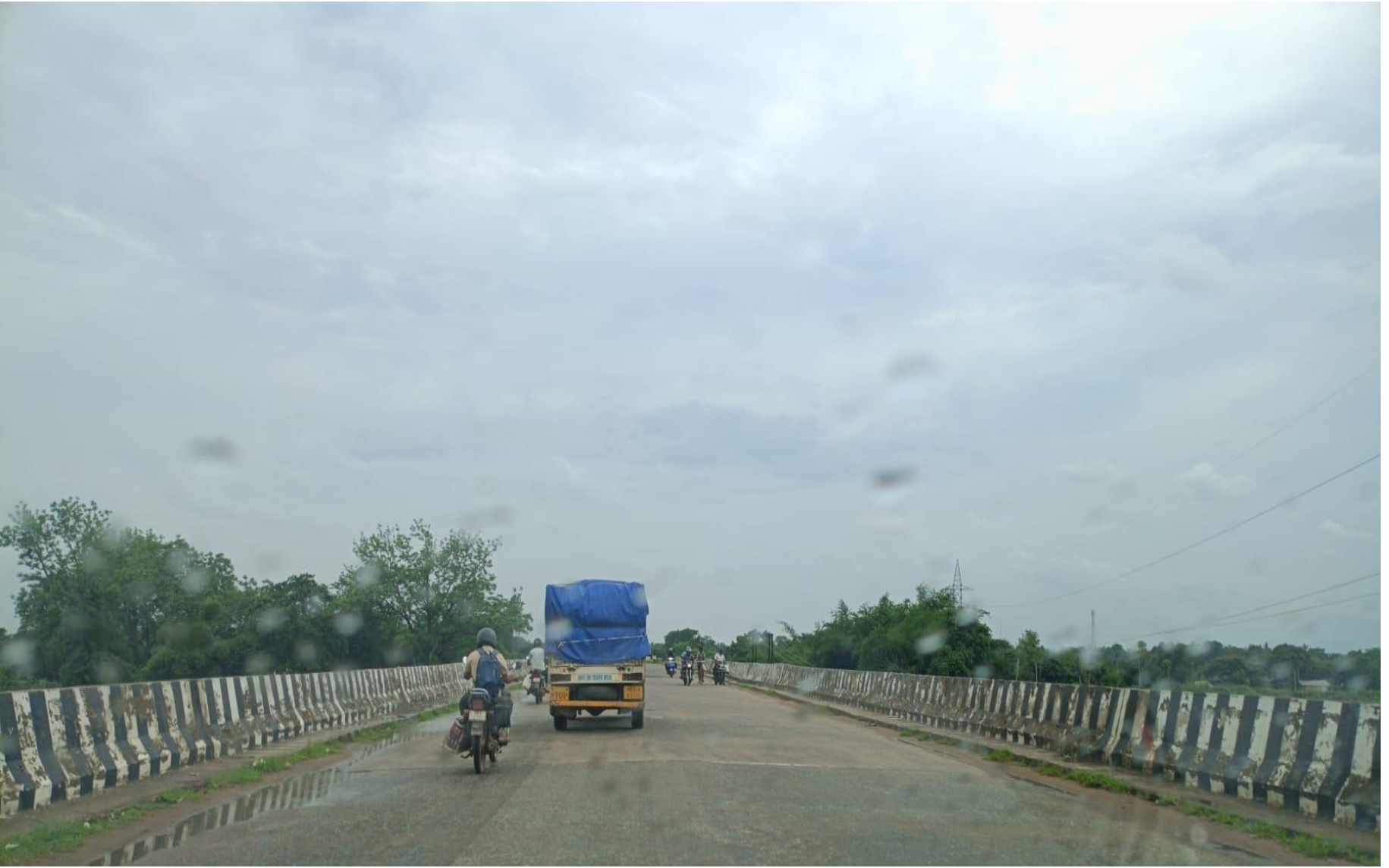
IMAGE: STRAIGHT ; Risk Level: Medium ; Coordinates: 21.544707, 86.933996