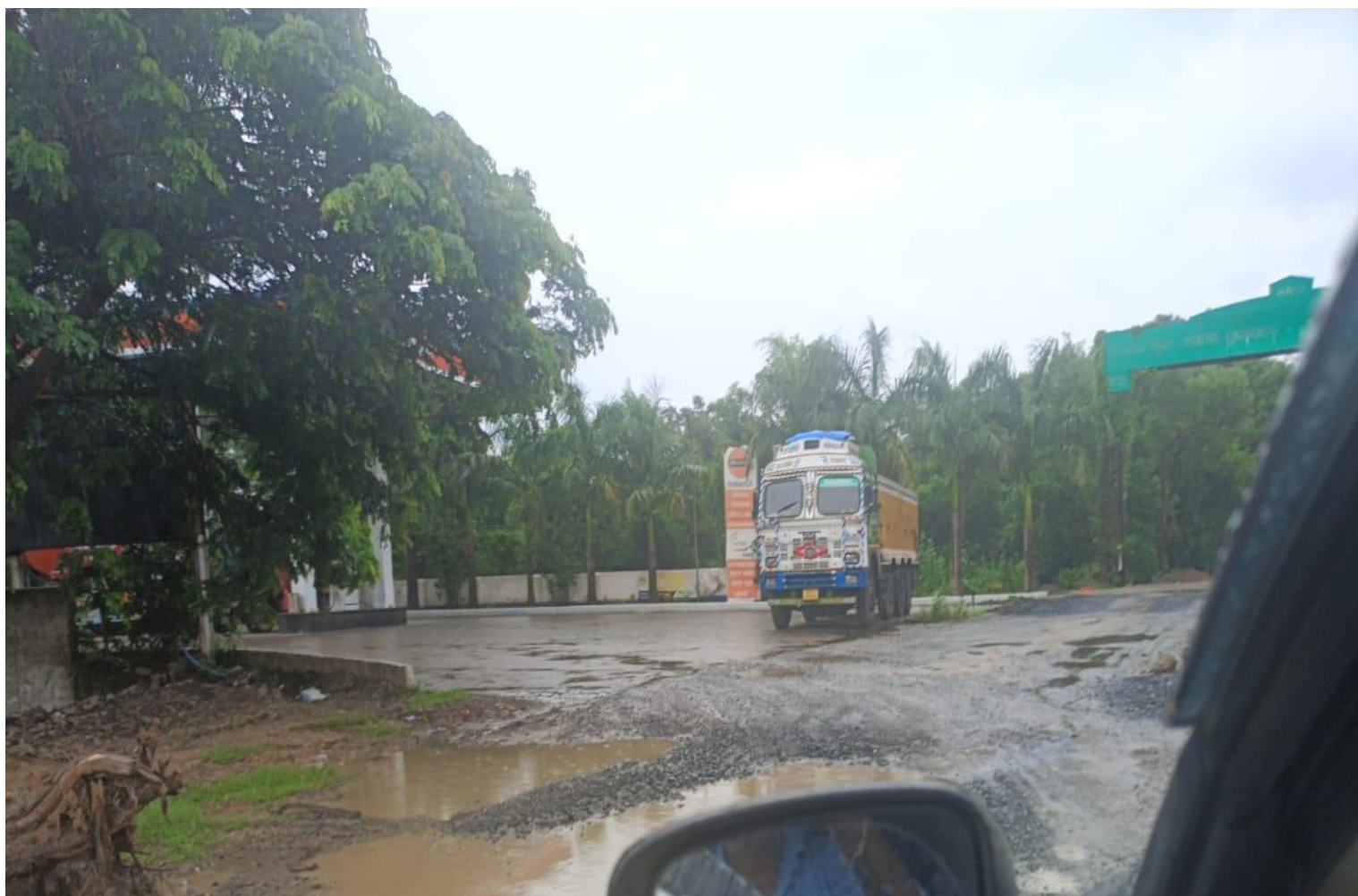
IMAGE: RIGHT TURN ; Risk Level: High ; Coordinates: 21.491857, 86.858955