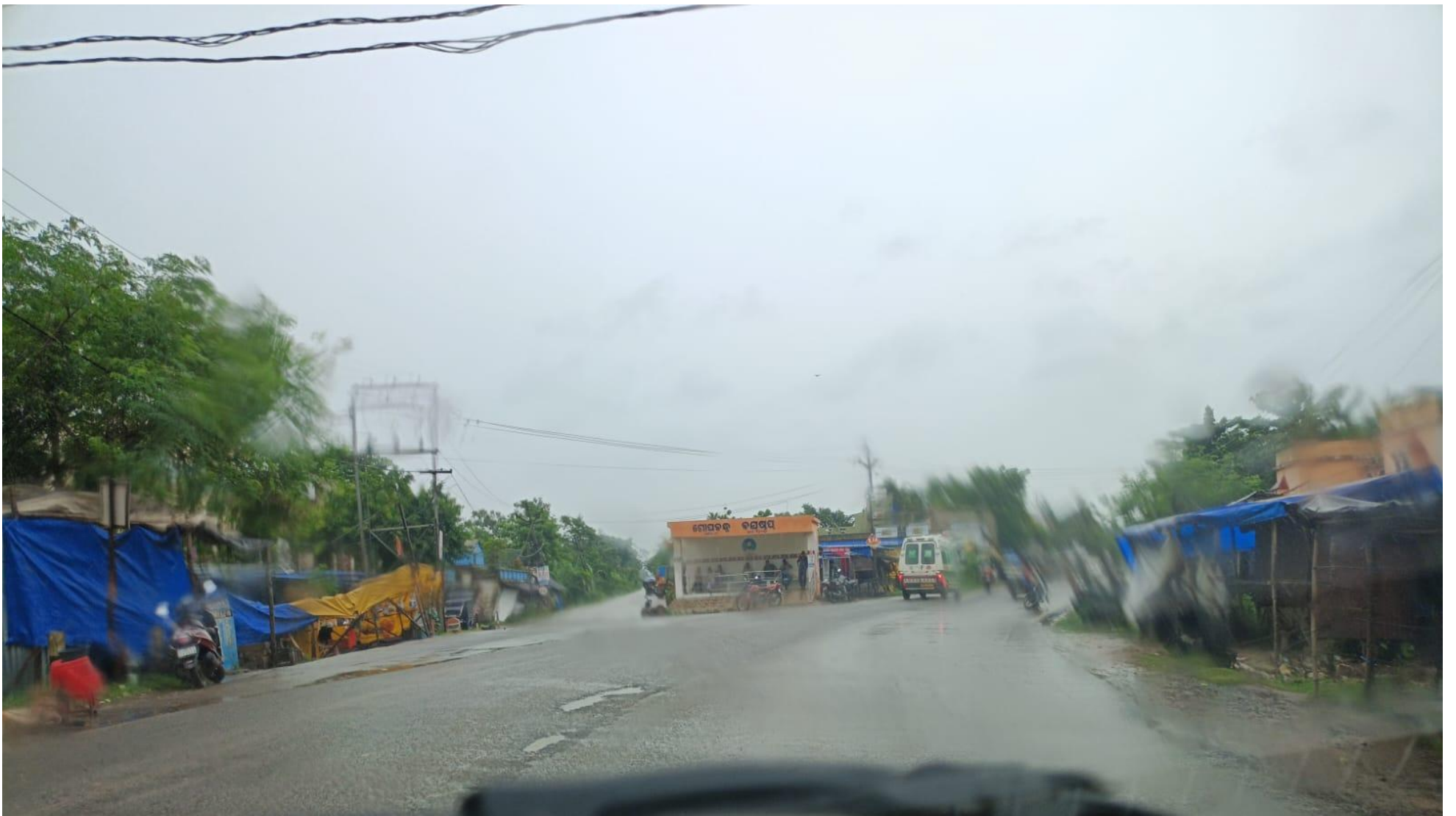
IMAGE: SHARP TURN ; Risk Level: High ; Coordinates: 21.80996, 87.259656