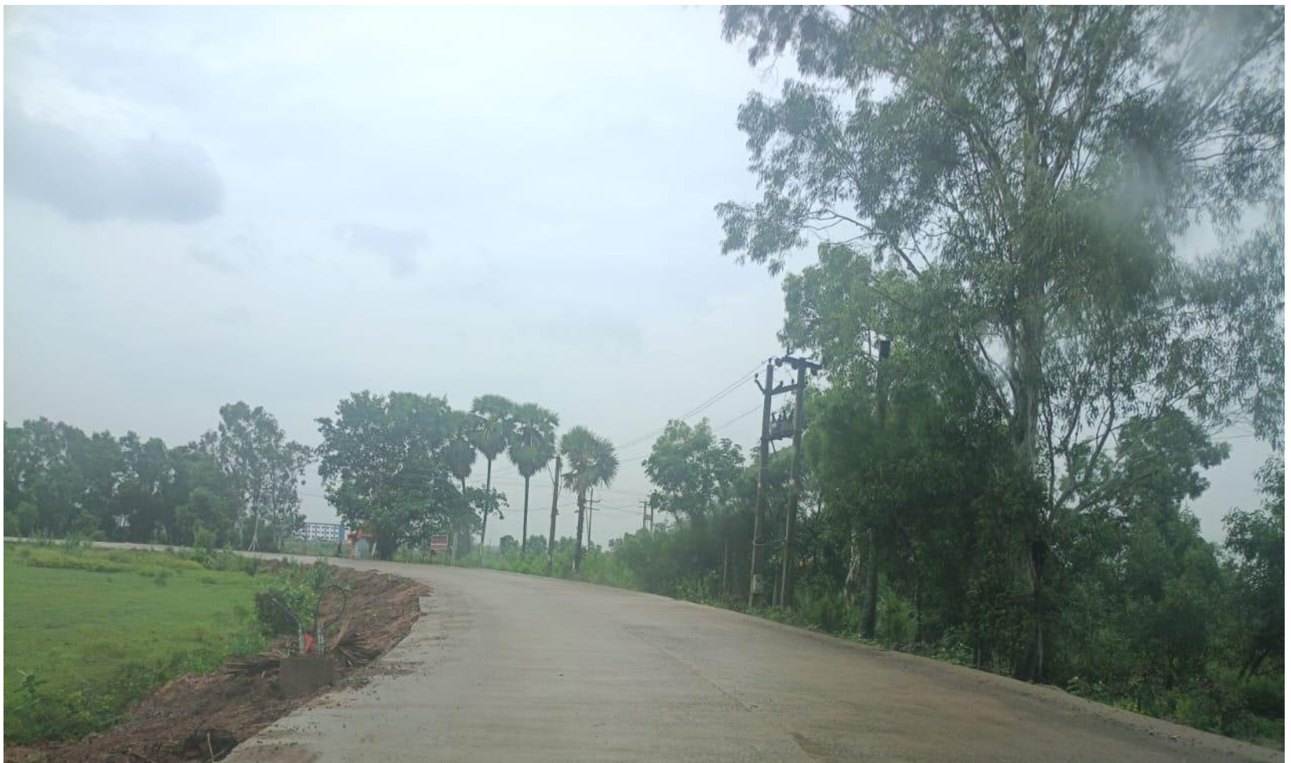
IMAGE: SHARP TURN LEFT ; Risk Level: High ; Coordinates: 21.489892, 86.861618