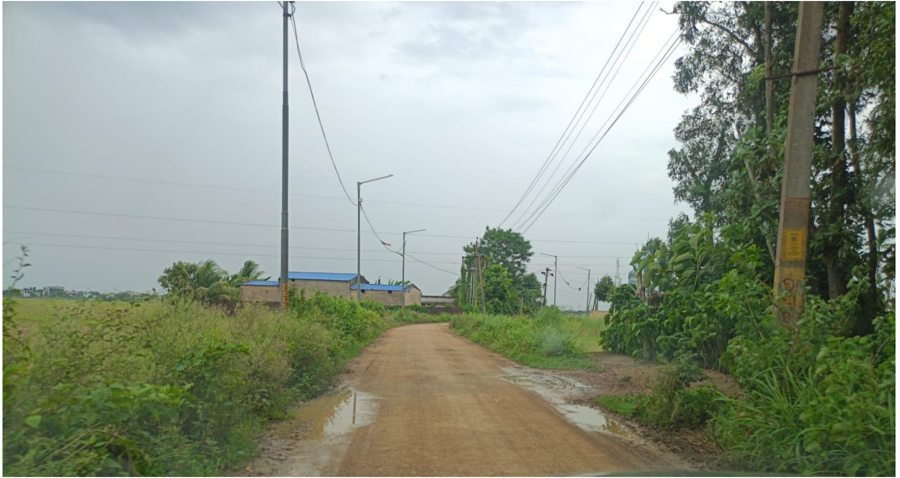
IMAGE: STRAIGHT ; Risk Level: Medium ; Coordinates: 21.783645, 87.220429