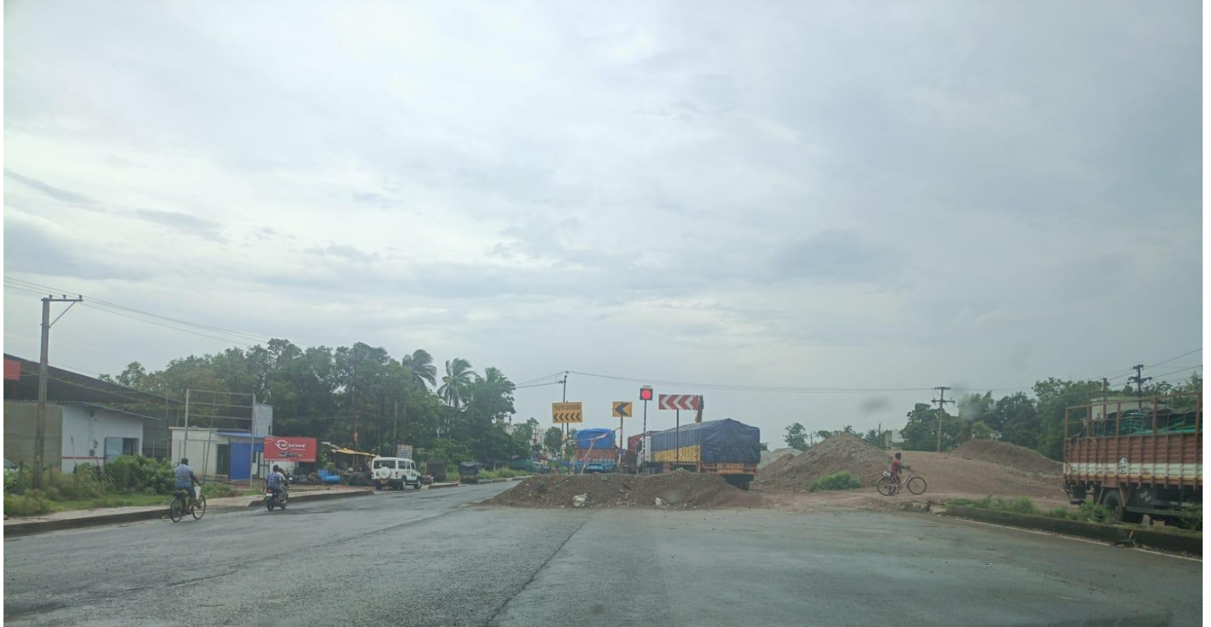
IMAGE: SHARP TURN LEFT ; Risk Level: High ; Coordinates: 21.525135, 86.895252