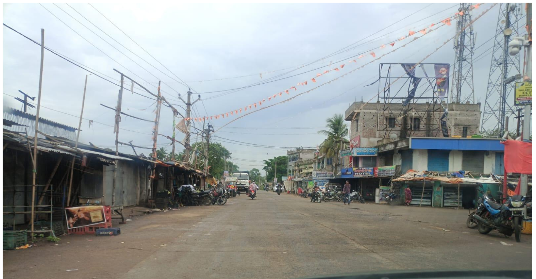
IMAGE: SHARP TURN RIGHT ; Risk Level: High ; Coordinates: 21.753826, 87.356602