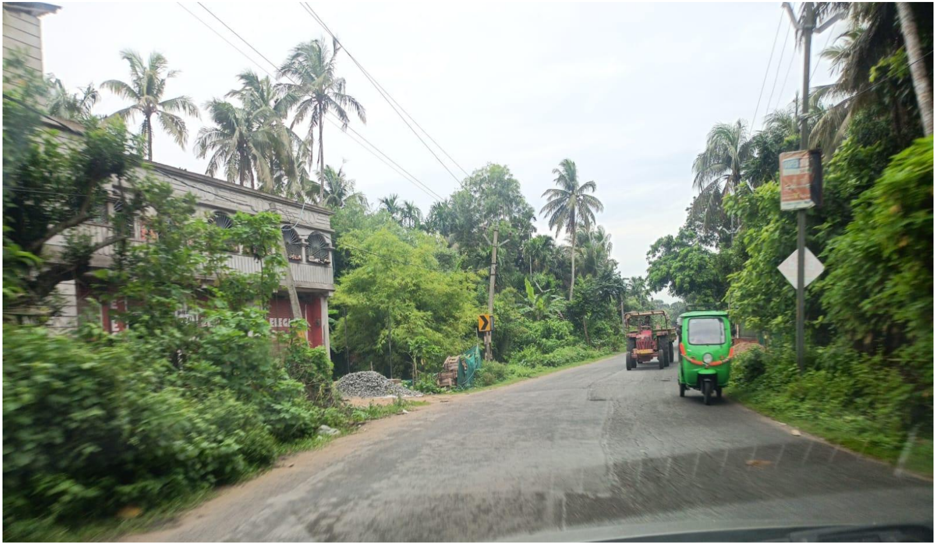
IMAGE: SHARP TURN RIGHT ; Risk Level: High ; Coordinates: 21.648192, 87.444551