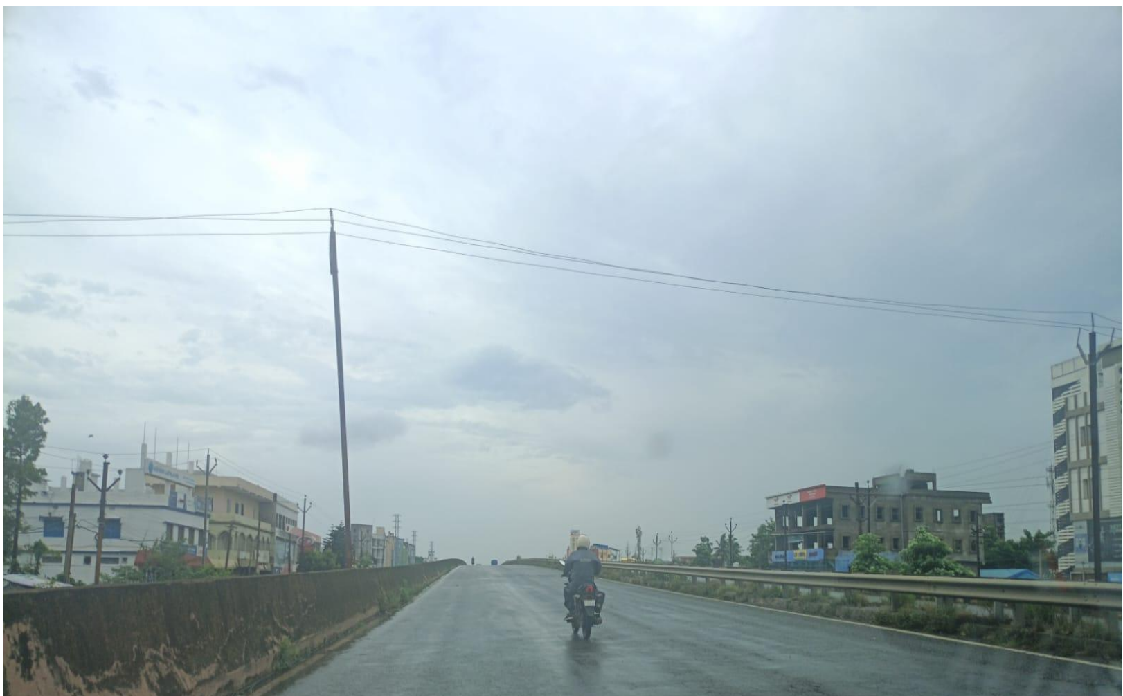
IMAGE: STRAIGHT ; Risk Level: Medium ; Coordinates: 21.511436, 86.892188