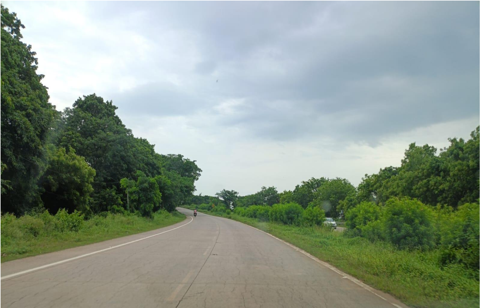
IMAGE: TURN LEFT ; Risk Level: MEDIUM ; Coordinates: 21.762208, 87.182905