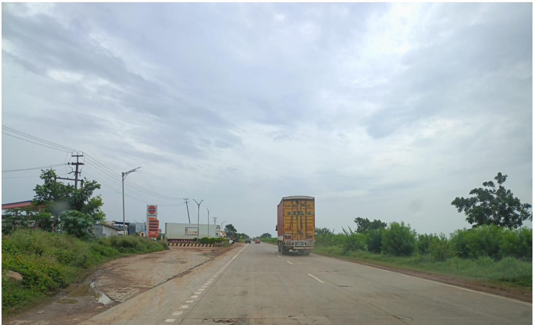
IMAGE: STRAIGHT ; Risk Level: Medium Coordinates: 21.776996, 87.21005