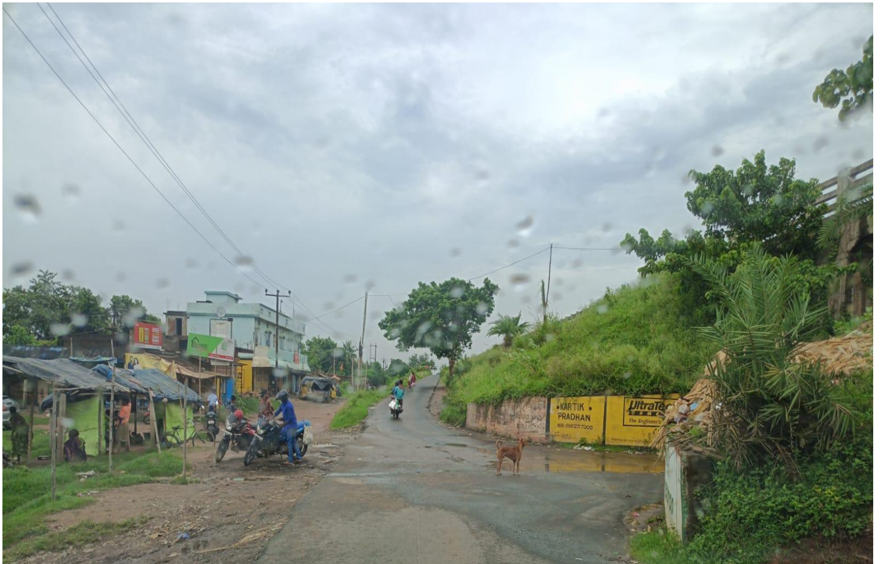
IMAGE: SHARP TURN RIGHT ; Risk Level: High ; Coordinates: 21.5494, 86.936415