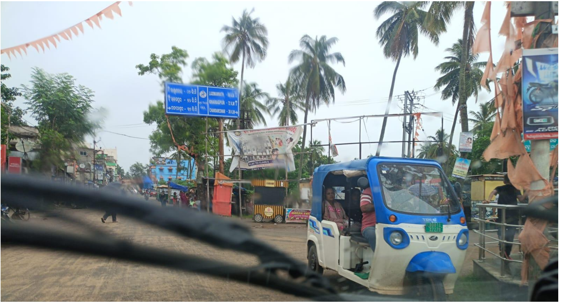
IMAGE: TURN LEFT ; Risk Level: Medium ; Coordinates: 21.803217, 87.225207