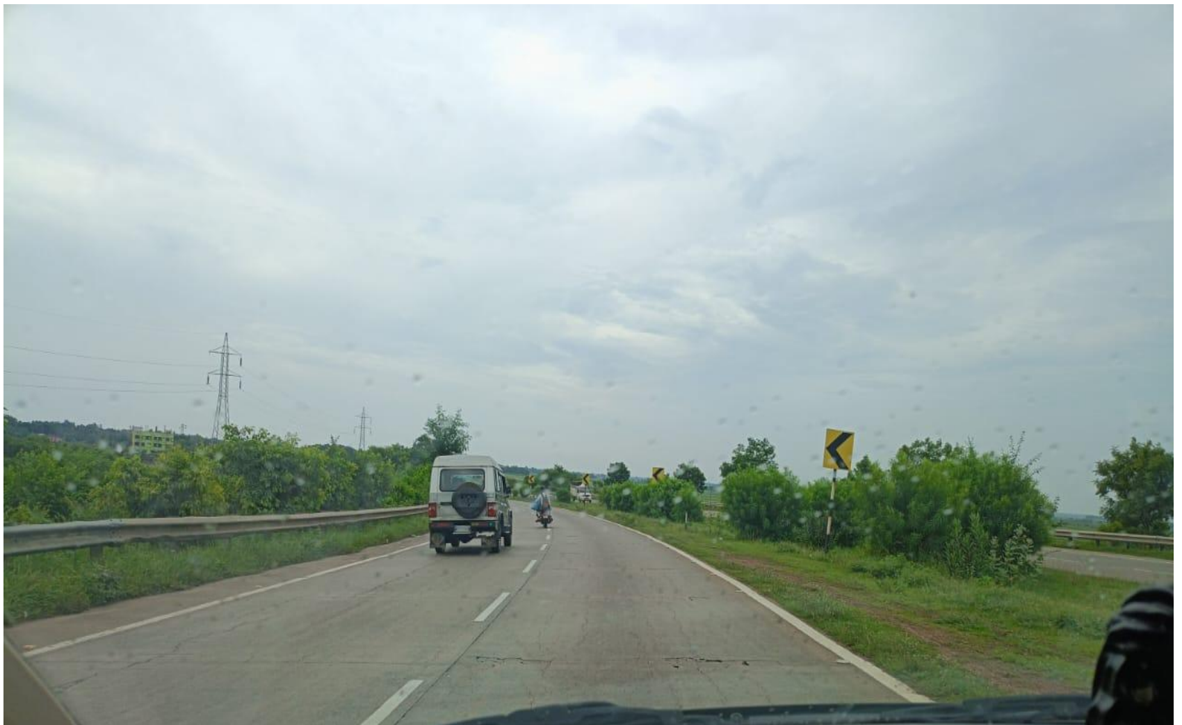
IMAGE: TURN LEFT ; Risk Level: MEDIUM ; Coordinates: 21.562817, 86.992197