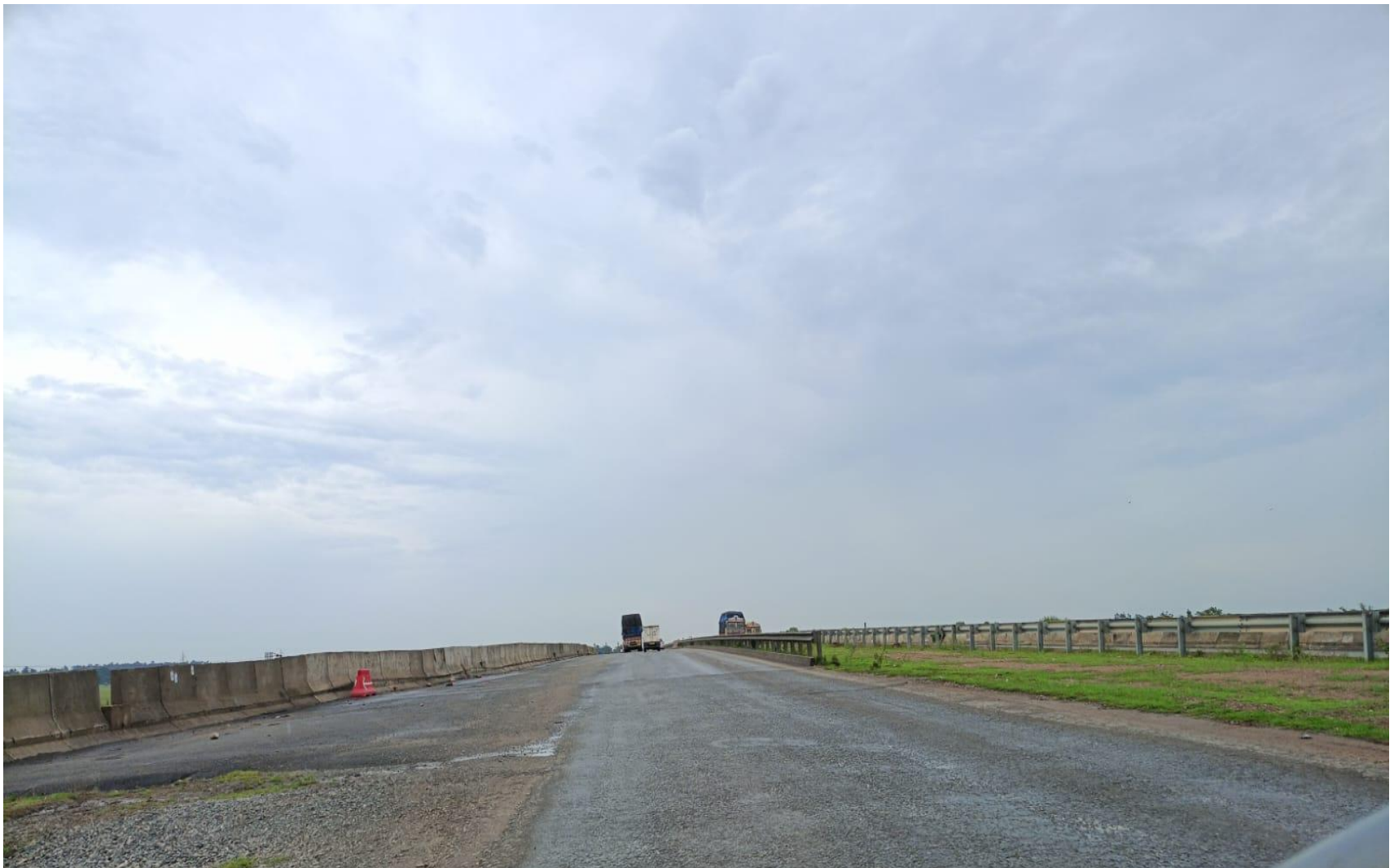
IMAGE: STRAIGHT ; Risk Level: High ; Coordinates: 21.538488, 86.90128