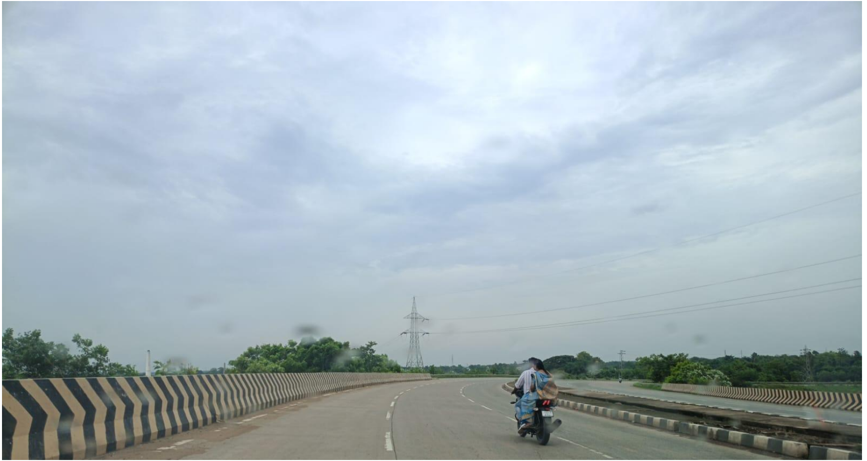
IMAGE: TURN RIGHT ; Risk Level: Medium ; Coordinates: 21.551086, 86.924864