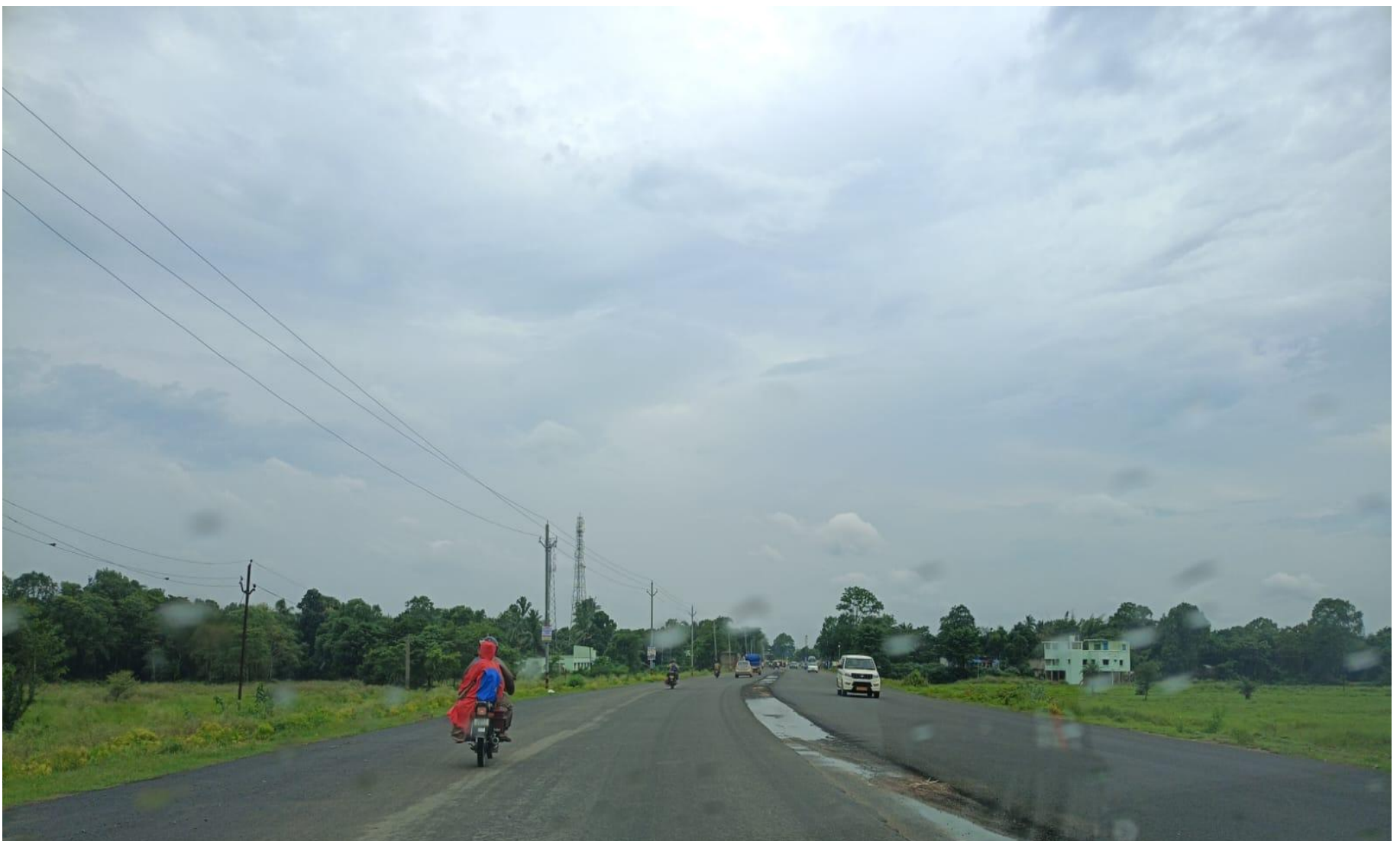
IMAGE: STRAIGHT ; Risk Level: MEDIUM ; Coordinates: 21.5385, 86.930403